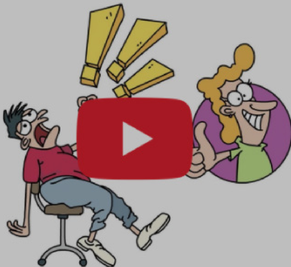
Filosofía de la campaña