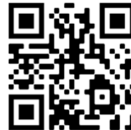
MIÉRCOLES, 3 DE FEBRERO: LOS JÓVENES Y SU MENSAJE DE ESPERANZA EN MEDIO DE LA PANDEMIA