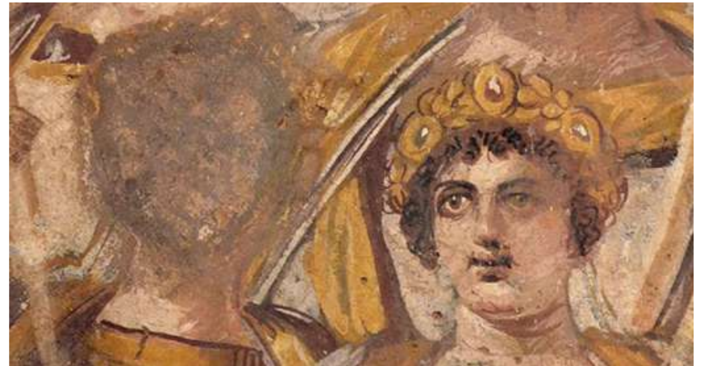
Tondo con la familia de Septimio Severo en el que aparecen retratados Severo, su esposa Julia Domna, sus hijos Caracalla y Geta, cuya cara ha sido borrada por su damnatio memoriae ordenada por su hermano y asesino Caracalla.

«Las leyes de memoria histórica se inscriben en esa misma tendencia desintegradora: se trata de grupos que pretenden blindar, usando para ello la fuerza coactiva del Estado»