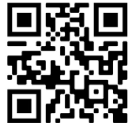
JUEVES, DE FEBRERO: SE NOS JUZGARÁ POR EL AMOR