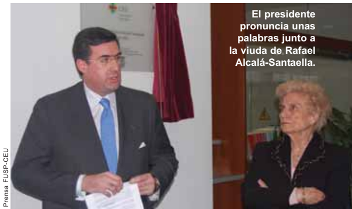
El presidente pronuncia unas palabras junto a la viuda de Rafael Alcalá-Santaella.