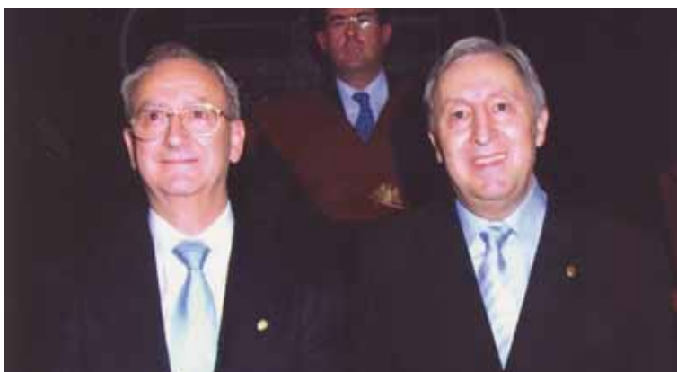
Colegio Mayor de San Pablo