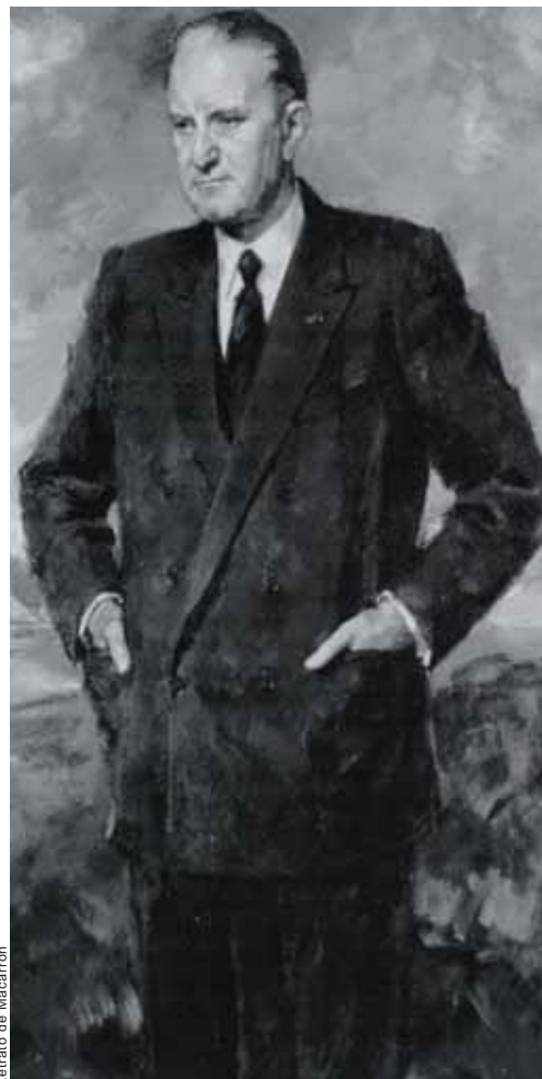
Retrato de Macarrón

Tras intervenir como embajador en la firma del Concordato con la Santa Sede, incorporó a España a la OCDE y al FMI durante sus años de ministro de Exteriores