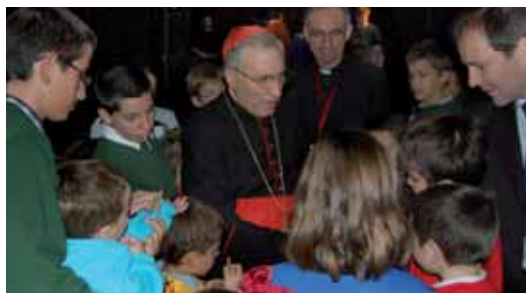
EL CARDENAL ROUCO CON LOS NIÑOS. Don Antonio María no quiso perderse el ya tradicional encuentro con los participantes en el Congreso Infantil. Los pequeños le cantaron el himno de Nuestra Señora de la Almudena y el cardenal lo pasó en grande saludándolos y contestando divertido a sus ocurrencias.