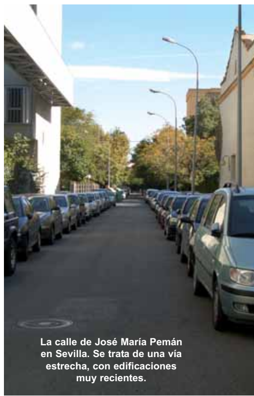
La calle de José María Pemán en Sevilla. Se trata de una vía estrecha, con edificaciones muy recientes.

Respecto a su faceta política, fue nombrado presidente de Acción Española y consiguió ser un activo orador antirrepublicano, monárquico y tradicionalista. En 1937 fue elegido diputado por Cádiz, y durante la guerra civil fue conocido como el Poeta alférez, que siente, canta y vive la nueva Epopeya Nacional. En este periodo fue nombrado presidente de la Comisión de Cultura y Enseñanza de la Junta Técnica de Urgos y colaboró muy activamente en las primeras emisiones de Radio Nacional de España . Posteriormente, fue consejero nacional de alange Española radicalista y de las Cortes y presidente del Consejo Privado de Juan de Borbón, donde fue encarcelado, hasta su disolución, en 1946.