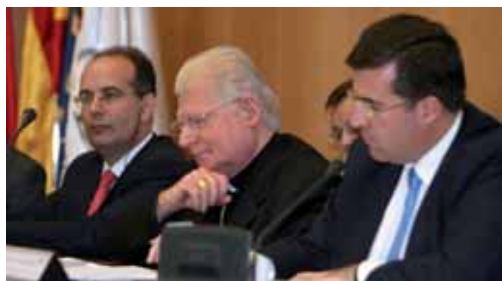
EL CARDENAL SCOLA PRESENTÓ EN EL CONGRESO SU ÚLTIMO LIBRO. El patriarca de Venecia, monseñor Angelo Scola, presentó su la edición española de su libro Una nueva laicidad en el marco del IX Congreso En la foto aparece flanqueado por Alfredo Dagnino Guerra (derecha) y Antonio Urzáiz.

Según dijo, la Iglesia sólo puede tener su espacio en un Estado que tenga en cuenta su propia autolimitación en un orden de valores, que actúe de antídoto ante tentaciones totalitarias como las