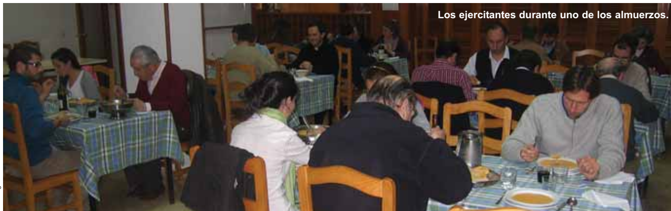
Los ejercitantes durante uno de los almuerzos.