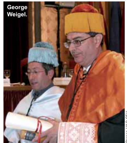
Prensa UAO CEU

americano, poniendo especial énfasis en el momento actual. El viejo continente, y muy especialmente la Europa occidental, atraviesa una crisis moral que podemos denominar moral civilizadora. Además, destacó la tragedia de un humanismo que deja a Europa sin alma, recordando que, en ese contexto, surgieron las grandes tiranías del siglo XX: comunismo, fascismo y nazismo.