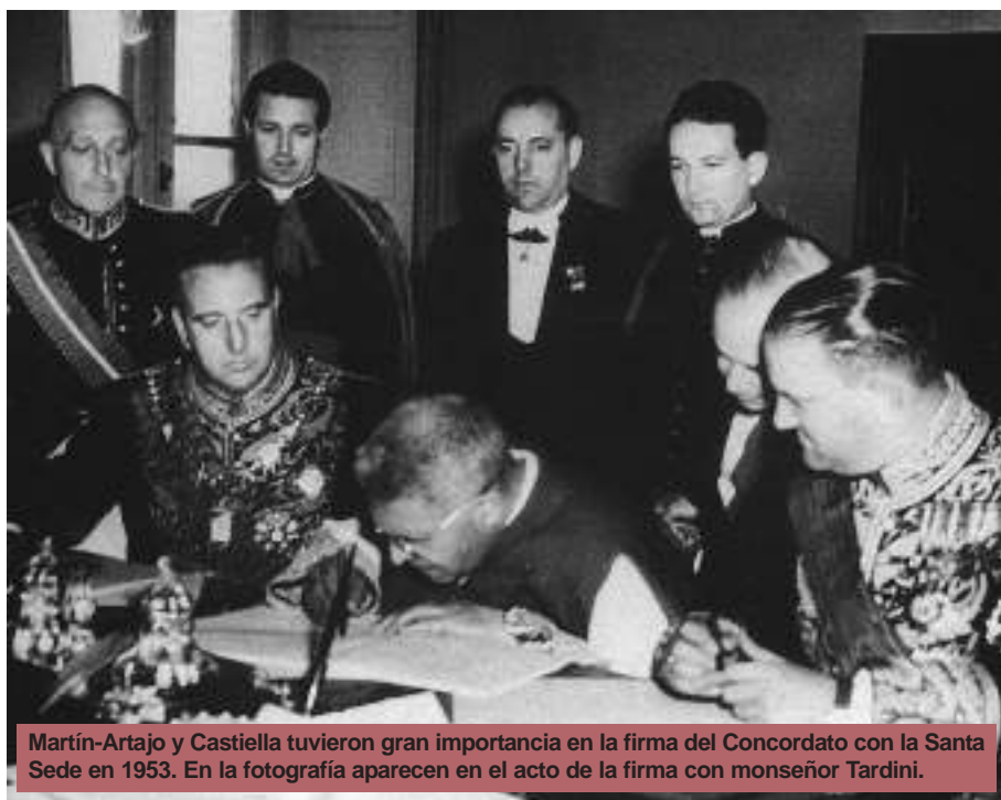
Martín-Artajo y Castiella tuvieron gran importancia en la firma del Concordato con la Santa Sede en 1953. En la fotografía aparecen en el acto de la firma con monseñor Tardini.

El primero expresó su gratitud comunicándole “la augusta gratitud del Santo Padre por sus particulares testimonios de devoción, manifestados al dejar el cargo de ministro de Asuntos Exteriores”. A lo que añadió “su notoria