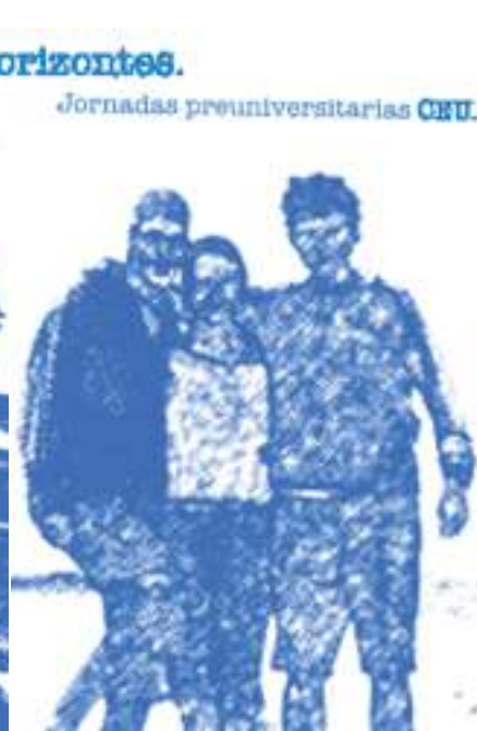
Imágenes que acompañan el cartel de las primeras Jornadas preuniversitarias que han puesto en marcha este año la Fundación Universitaria San Pablo-CEU y la ACdP.

“La Universidad es un mundo nuevo, una realidad diferente en la que se madura personal e intelectualmente”