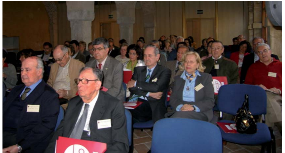
Las Jornadas se celebraron en los salones del Palacio Villapanes, sede de la ACdP y del CEU en Jerez de la Frontera, en la fotografía, el público asistente en uno de los momentos de las II Jornadas 'Católicos y Vida Pública' jerezanas.