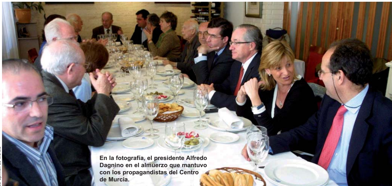
En la fotografía, el presidente Alfredo Dagnino en el almuerzo que mantuvo con los propagandistas del Centro de Murcia.