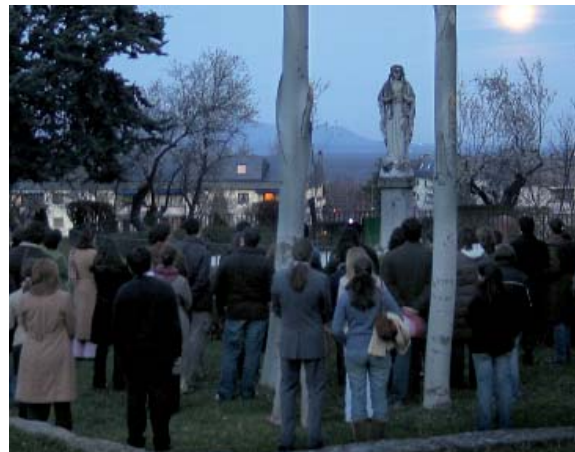
En el atardecer del sábado 3 de marzo, ante una imagen de la Virgen María y con la luna llena de fondo, se rezó el Santo Rosario por los jardines de la casa de espiritualidad San José.