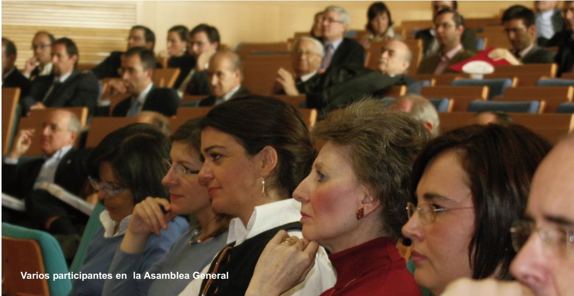
Varios participantes en la Asamblea General