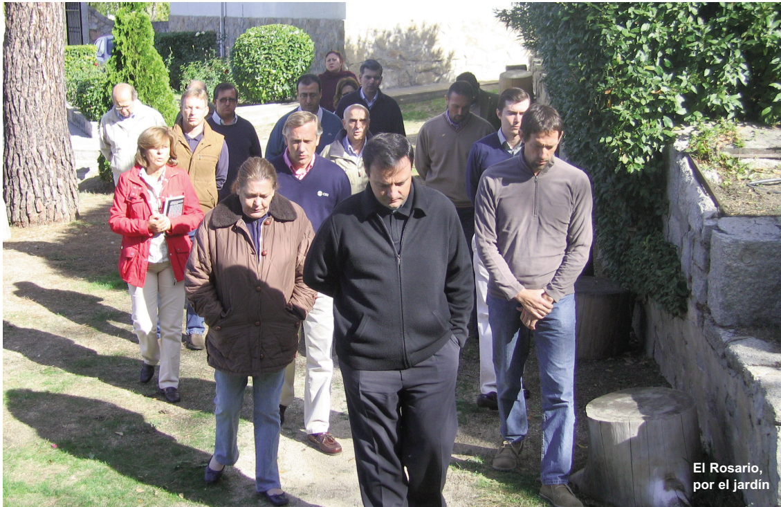
El Rosario, por el jardín