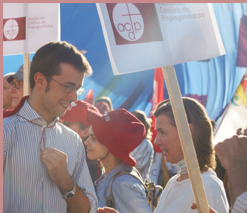
Los de Madrid y Getafe también estuvieron allí, pancartas incluidas