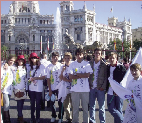
Todos estos jóvenes se vinieron desde El Puerto de Santa María.