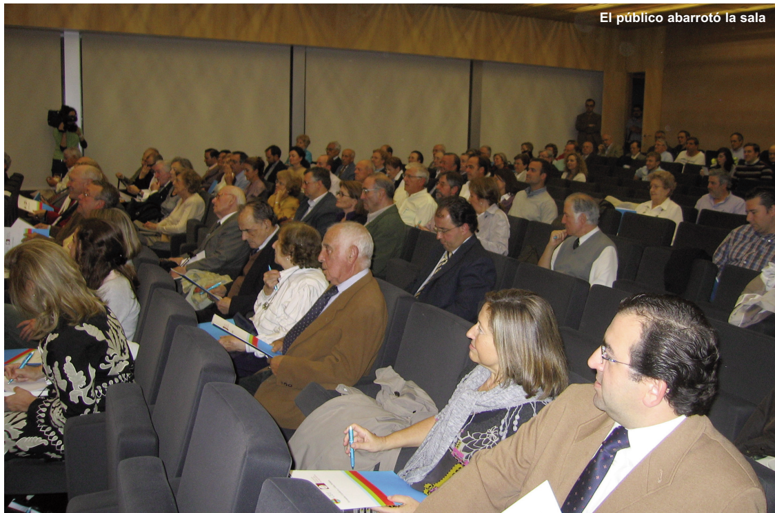
El público abarrotó la sala

nosotros”, para reformar la educación con exigencia, para retornar a la honradez y no esperar nada “de los políticos, todos malos”.