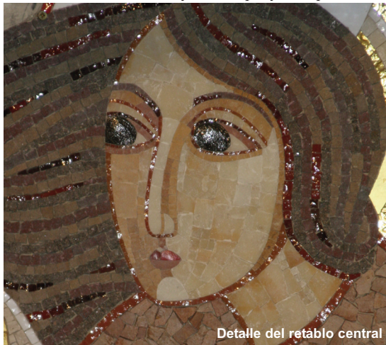
Detalle del retablo central

Renegó de la actual estética de usar y tirar: “No hay belleza a primera vista, como la de un spot publicitario, que gusta al principio, pero después de verlo cinco veces pasa a ser desechado”. Explicó que “la Belleza es la encarnación de la Verdad y del Bien. Si el Bien o la Verdad no se encarnan como Belleza, surge la dictadura del moralismo o las ideologías”.