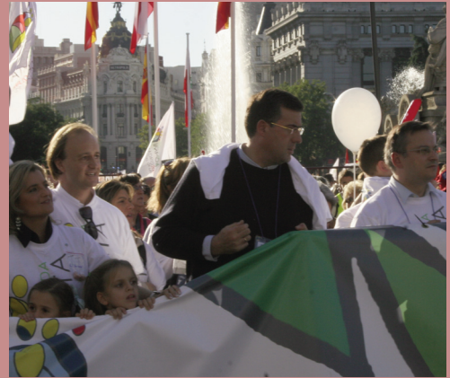
Otro momento de la manifestación que recorrió el centro de Madrid.