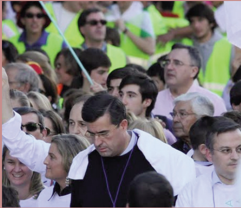
El presidente sostuvo la pancarta que encabezaba la marcha.