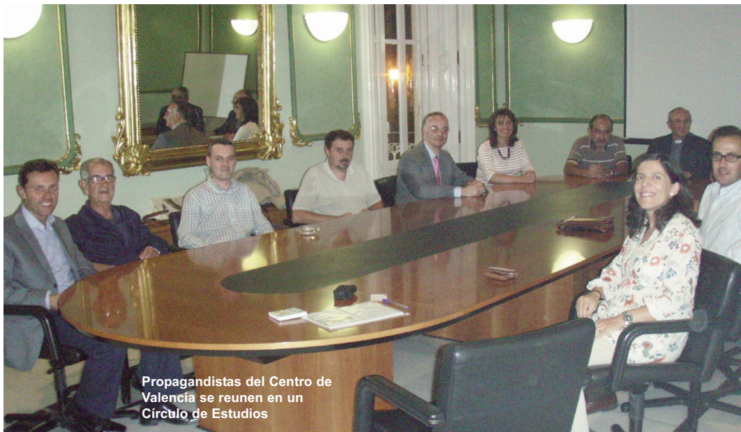
Propagandistas del Centro de Valencia se reúnen en un Círculo de Estudios

En el Centro de Valencia, los círculos de estudios se reanudaron el 24 de septiembre. En el círculo del palacio de Colomina se tiene previsto analizar durante este trimestre la nueva encíclica del Papa Caritas in veritate . En el círculo del CEU, además de continuar con la elaboración de los vídeos sobre la Humanae vitae , también se estudiará la última encíclica del Papa.