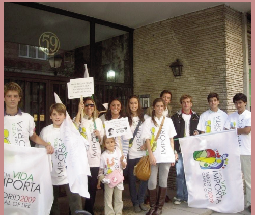
Andalucía estuvo muy presente. Una familia preparada para el 17-O.