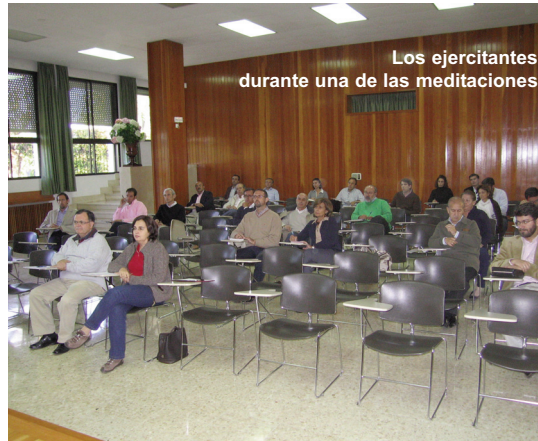
Los ejercitantes durante una de las meditaciones

por ti? Y en ella encontraréis palabras sobre qué hacer y cómo hacerlo. Cuando Jesús afirma en el madero que ‘todo está cumplido’, lo que hace es recordarnos que en esta vida tenemos un camino, una vocación y un proyecto que llevar a término. No somos fruto del azar. Estamos aquí porque el Señor nos ha creado”, finalizó.