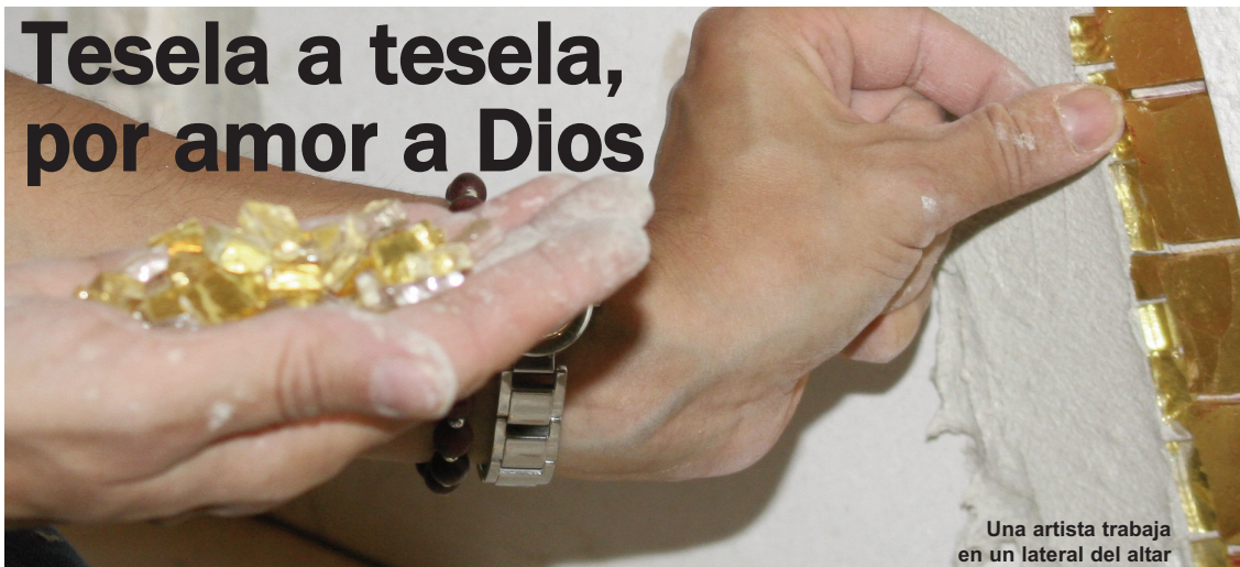
Una artista trabaja en un lateral del altar

La capilla del Colegio Mayor de San Pablo, de la ACdP, será considerada como una de las grandes obras maestras del arte moderno. El jesuita Marko Ivan Rupnik está decorándola con sus ya prestigiosos mosaicos. Aunque falta un largo camino, ya están el retablo, el altar y el ambón. Rupnik explicó a los alumnos de la Universidad CEU San Pablo el trabajo que está realizando con su equipo.