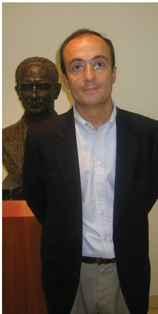
figuras, dos puestos, ocupados por socios de la ACdP, el de director y el de secretario general, que ocupo yo.