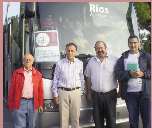
Desde Alicante llegaron en autobús, con un cartel de la ACdP.