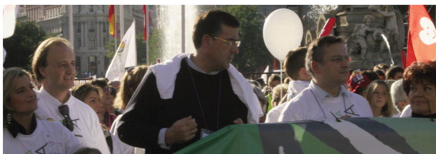
El presidente encabezó la manifestación del 17-O

organización de la manifestación, estuvo allí. Llegaron desde todos los centros. >> 13