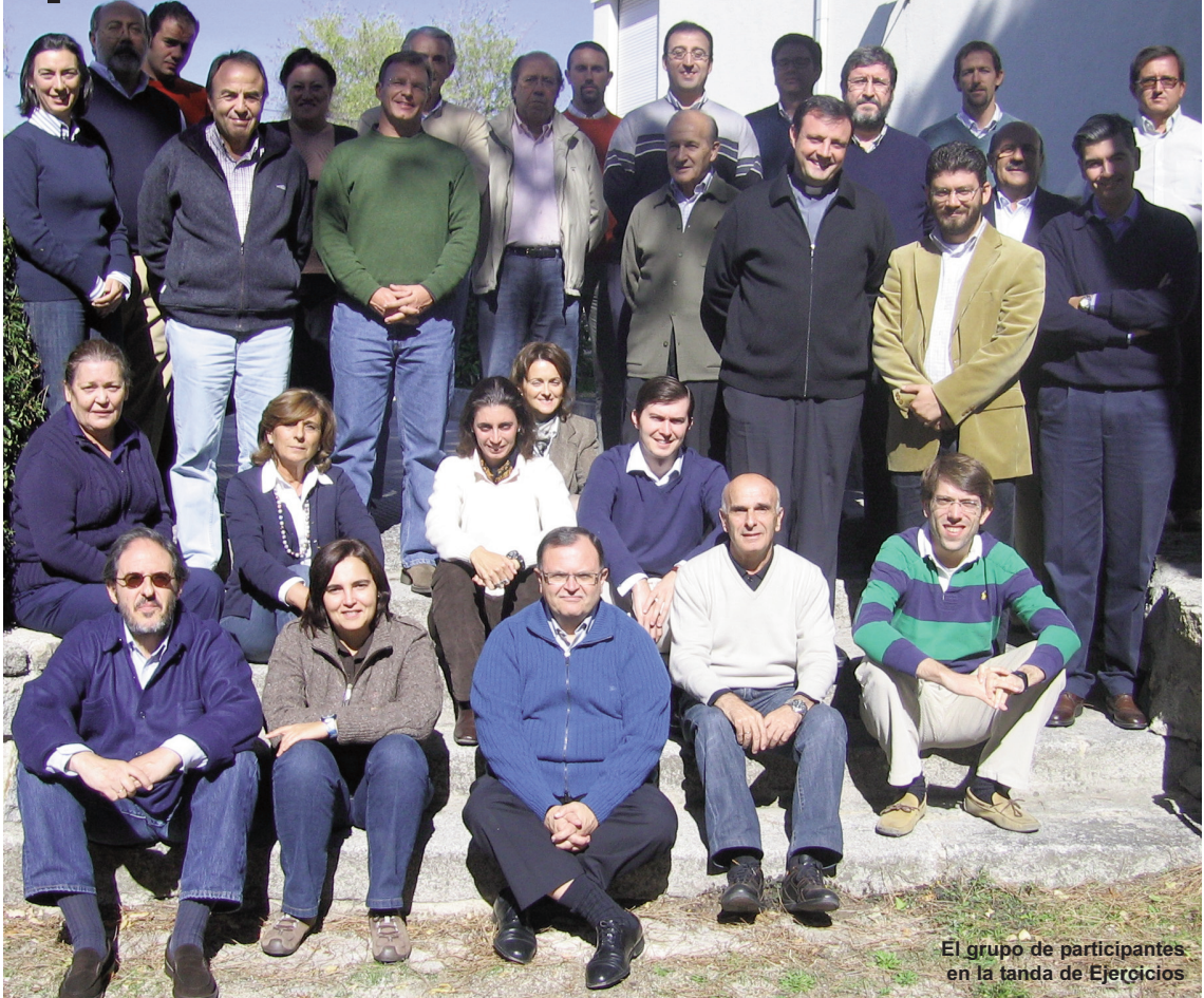
El grupo de participantes en la tanda de Ejercicios

“No podemos ser apóstoles sin que Cristo inunde nuestra vida”