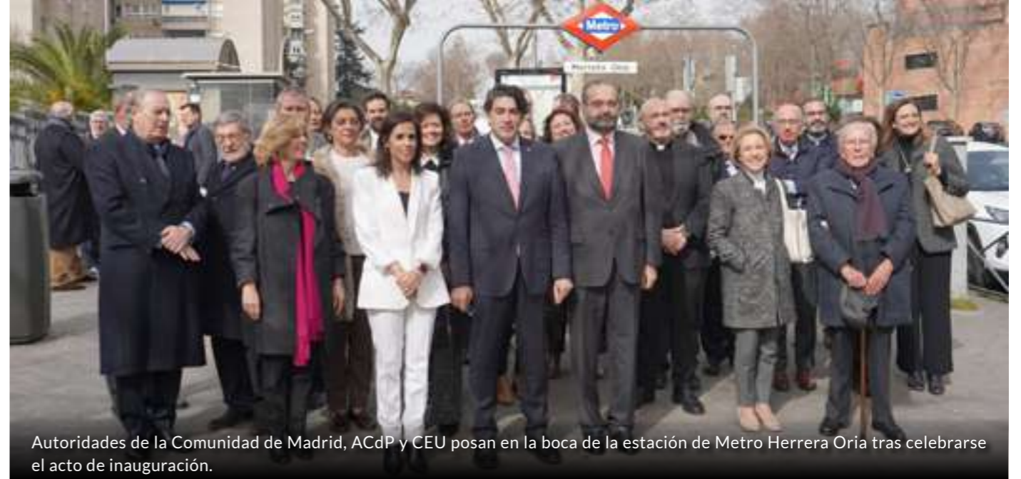
Autoridades de la Comunidad de Madrid, ACdP y CEU posan en la boca de la estación de Metro Herrera Oria tras celebrarse el acto de inauguración.