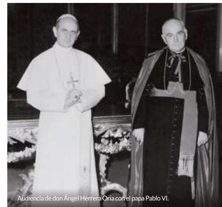
Audiencia de don Ángel Herrera Oria con el papa Pablo VI.