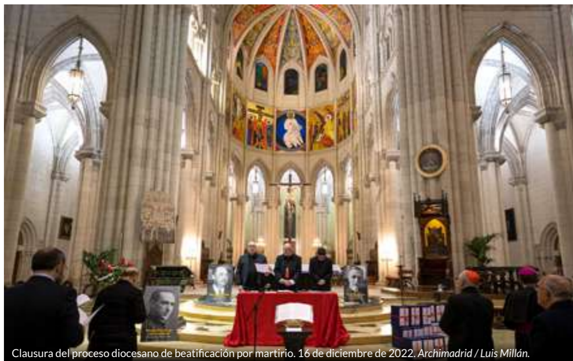
Clausura del proceso diocesano de beatificación por martirio. 16 de diciembre de 2022.