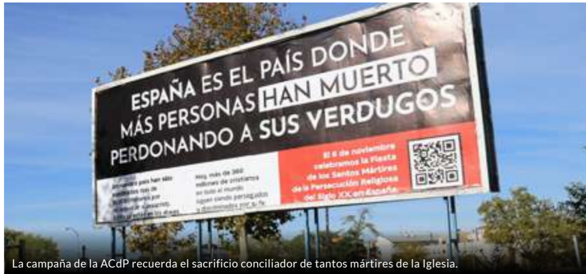
La campaña de la ACdP recuerda el sacrificio conciliador de tantos mártires de la Iglesia.