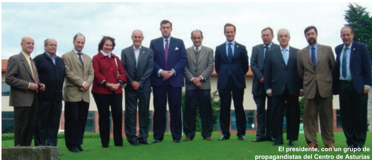
El presidente, con un grupo de propagandistas del Centro de Asturias