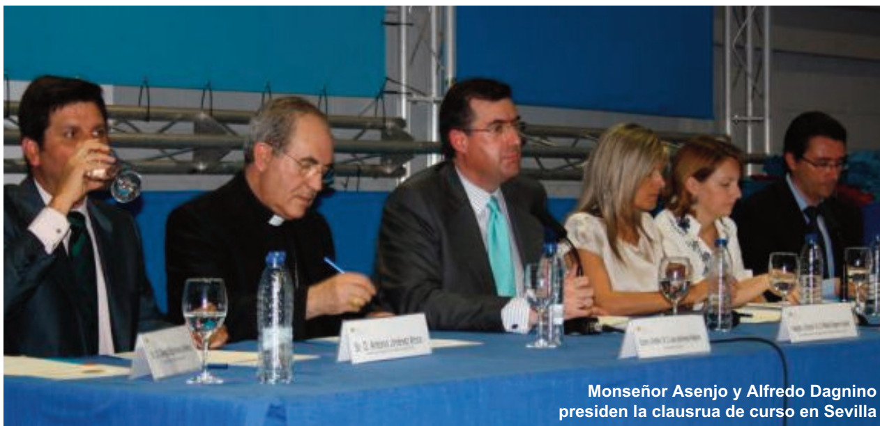
Monseñor Asenjo y Alfredo Dagnino presiden la clausura de curso en Sevilla