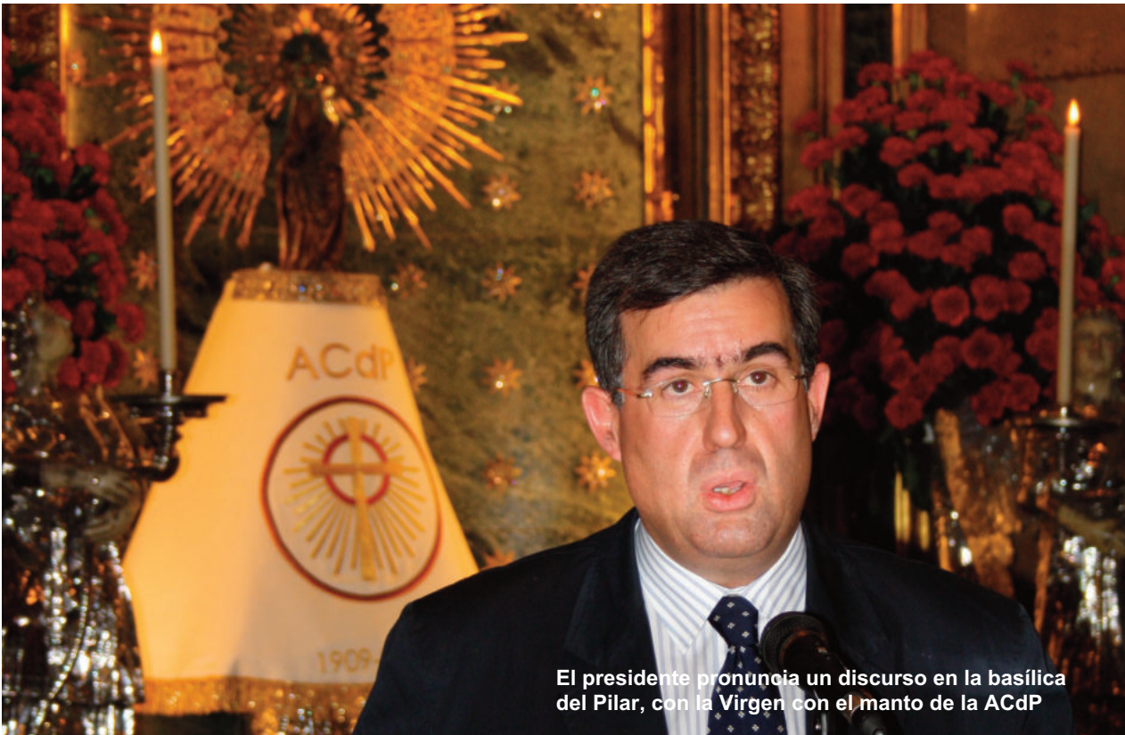
El presidente pronuncia un discurso en la basílica del Pilar, con la Virgen con el manto de la ACdP