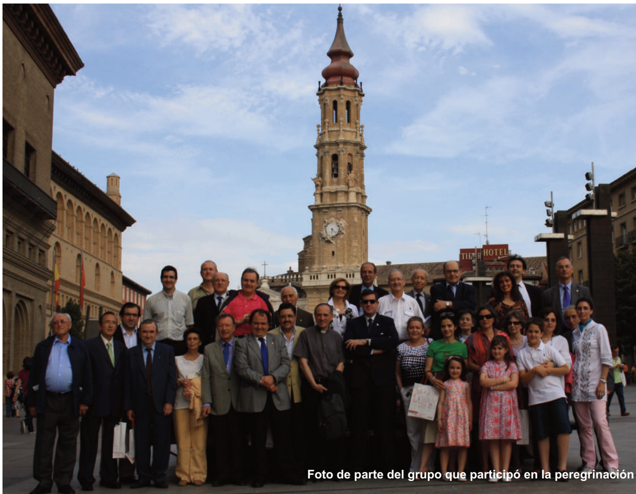
Foto de parte del grupo que participó en la peregrinación