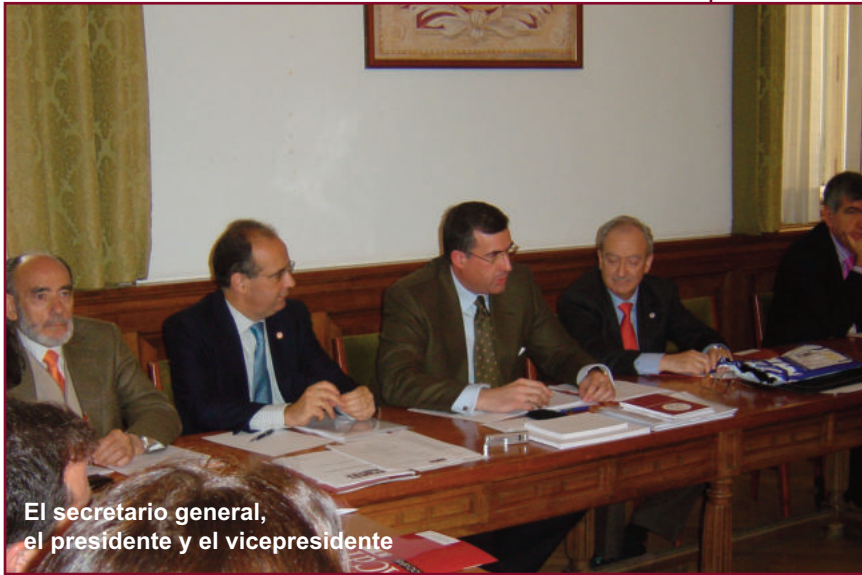
El secretario general, el presidente y el vicepresidente