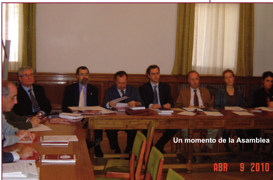
Un momento de la Asamblea