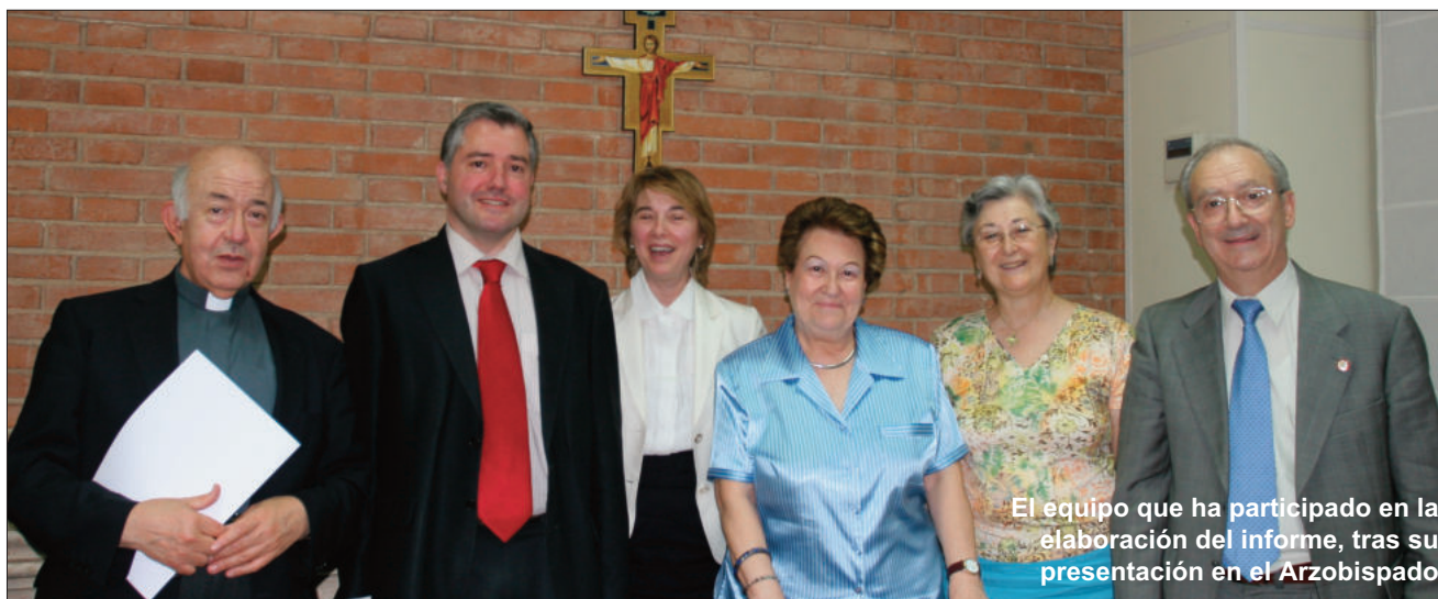
El equipo que ha participado en la elaboración del informe, tras su presentación en el Arzobispado