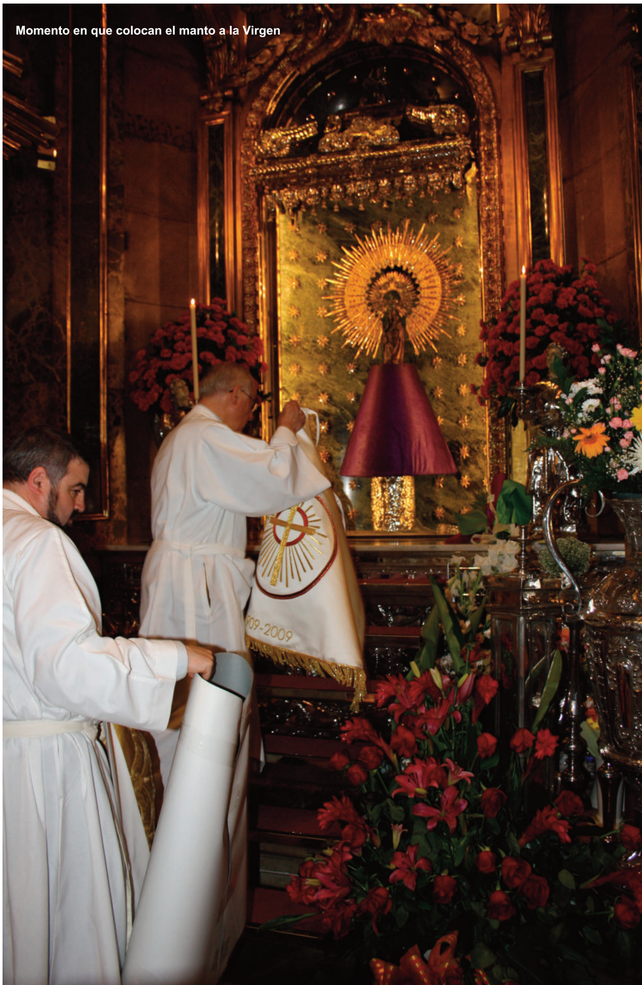
Momento en que colocan el manto a la Virgen