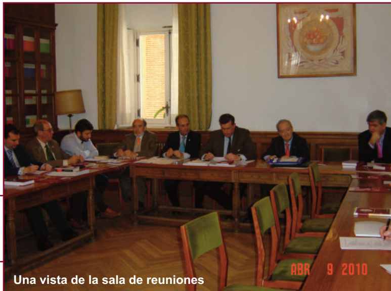
Una vista de la sala de reuniones