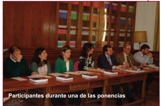
Participantes durante una de las ponencias