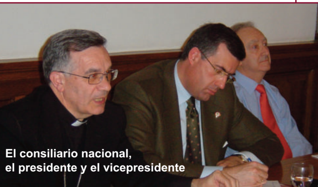
El consiliario nacional, el presidente y el vicepresidente

Comenzó Borobio su exposición con un breve repaso a la situación política y social por la que atravesaba España cuando, a principios del siglo XX, nace la Asociación Católica de Propagandistas. En ese momento, “los católicos, a pesar de que constituyen la inmensa masa del pueblo español, apenas tienen influencia social”. El Vaticano conocía la situación. El nuncio, monseñor Antonio Vico, habla con el padre Ángel Ayala para poner solución. De ahí nace ese “grupo de jóvenes selectos” que tenían por objetivo “el apremiante despertar de las conciencias dormidas de los católicos españoles, unidos en eficaces acciones en servicio de la Iglesia y de la sociedad”.