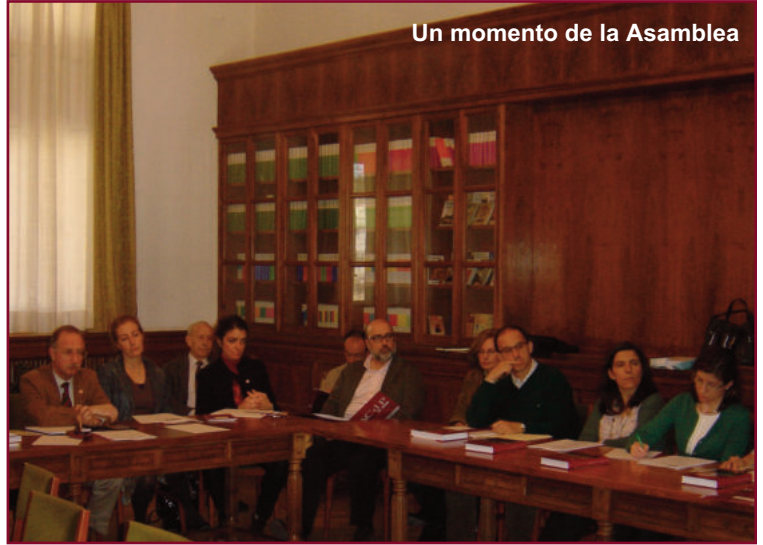
Un momento de la Asamblea

Para concluir, quiso “volver sobre la primera y constante misión en la que se encuentran las demás y para cuya respuesta nacemos: la defensa y propagación de la fe católica: omnia instaurare in Christo ”.