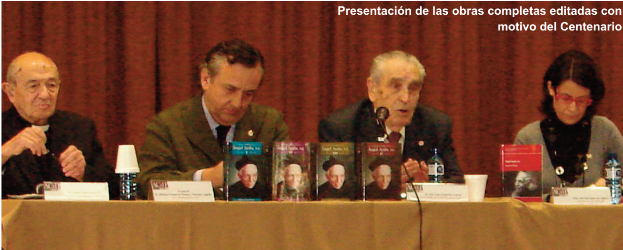
Presentación de las obras completas editadas con motivo del Centenario

en la Iglesia. Sin él, no hubiese existido Ángel Herrera”, afirmó. En segundo lugar, el Ayala vanguardista: “Debemos estar dispuestos a embarrarnos los pies para llevar la verdad a los diferentes sitios”, decía el padre jesuita. En tercer lugar, el Ayala reformador: “Ángel Ayala tuvo claro el concepto de educación católica a favor de la fe”, aseveró el ponente.