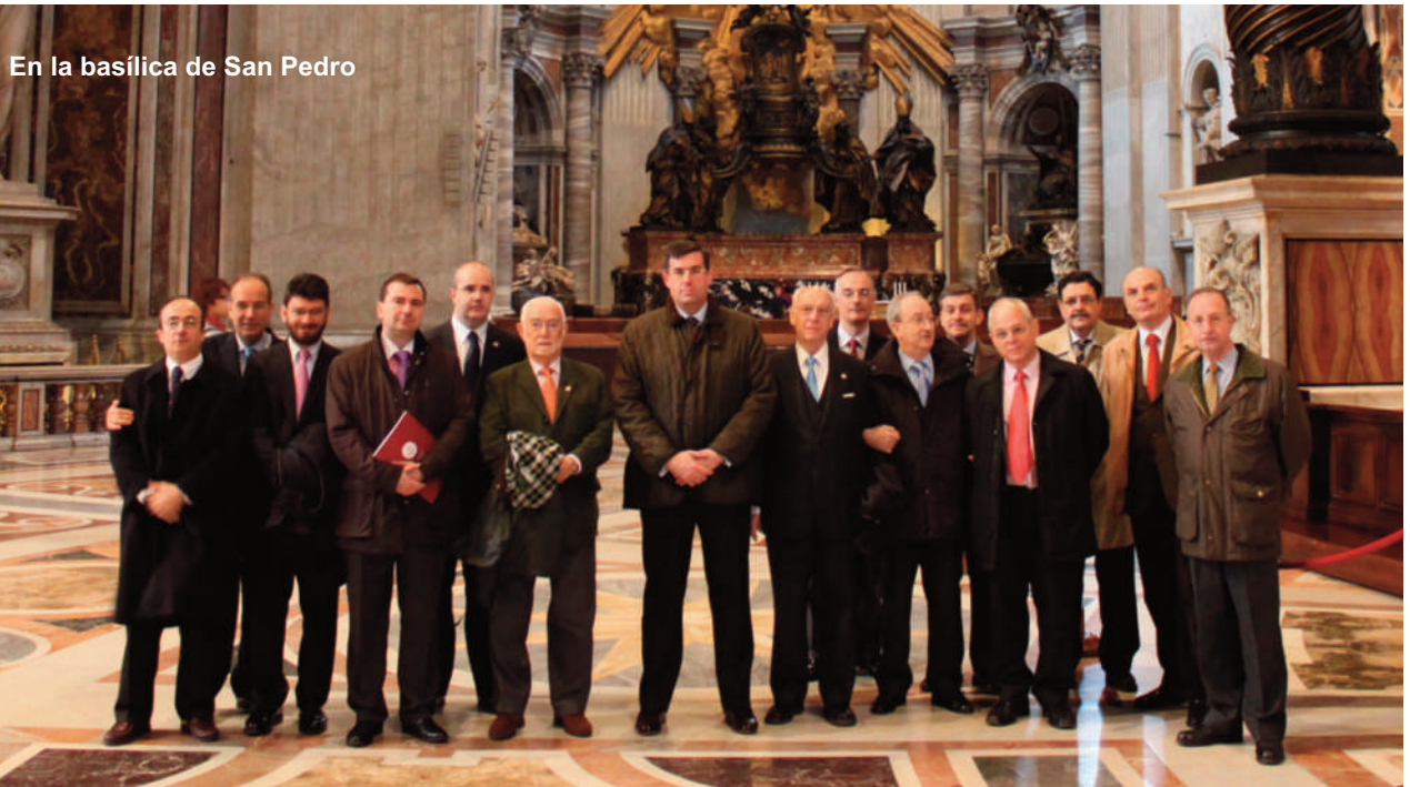
En la basílica de San Pedro

N.d.R.: se está preparando un boletín especial con información pormenorizada del viaje