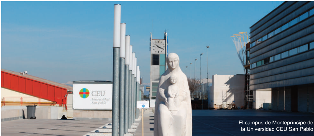
El campus de Montepíncipe de la Universidad CEU San Pablo