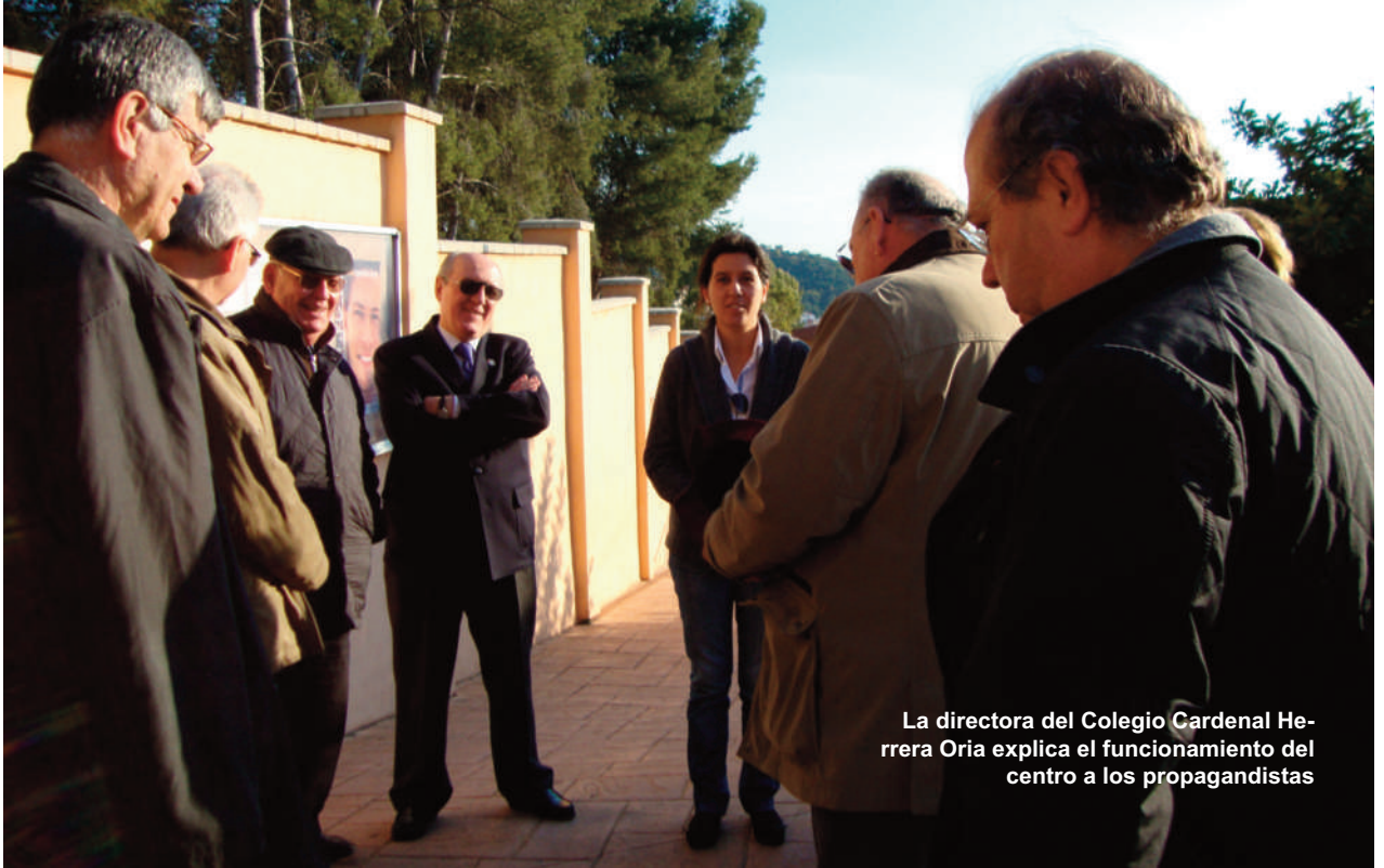
La directora del Colegio Cardenal Herrera Oria explica el funcionamiento del centro a los propagandistas