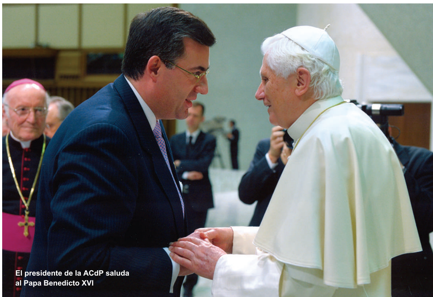
El presidente de la ACdP saluda al Papa Benedicto XVI