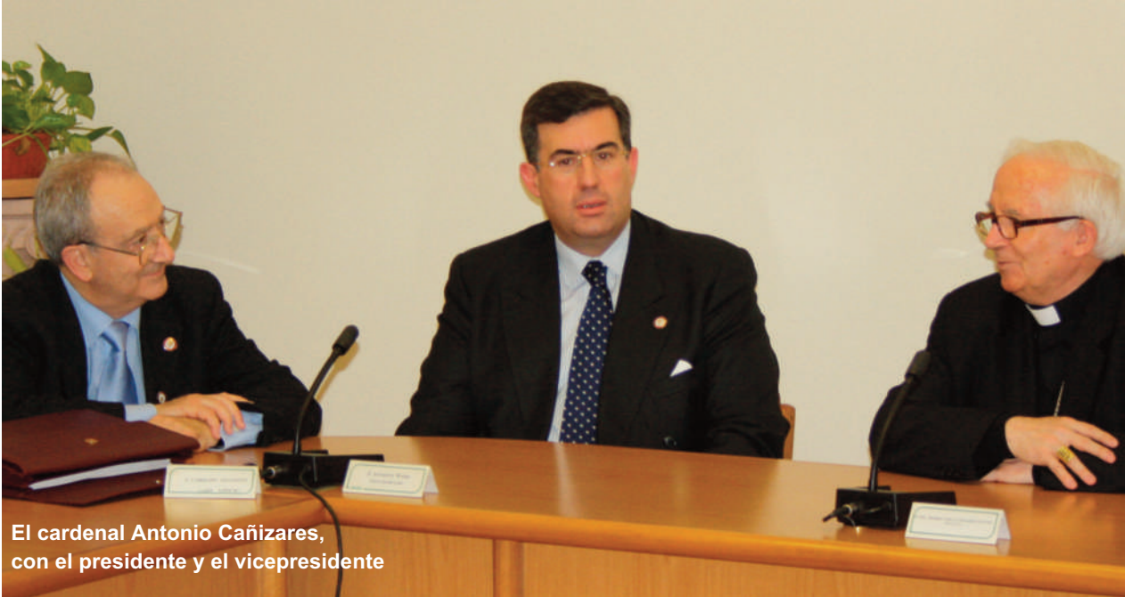
El cardenal Antonio Cañizares, con el presidente y el vicepresidente

mundo, mediante la educación y la presencia en los medios de comunicación”, comentó. Un antiguo colegial del Colegio Mayor de San Pablo, el embajador español ante la Santa Sede, Francisco Vázquez, compartió sus recuerdos de aquella etapa y explicó el peso de nuestro país en el Vaticano. La reunión con el prelado del Opus Dei, monseñor Javier Echevarría, cerró el día.