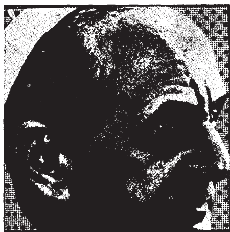
CENTRO DE ESTUDIOS UNIVERSITARIOS

Unos libros que no deben faltar en la biblioteca de todo propagandista