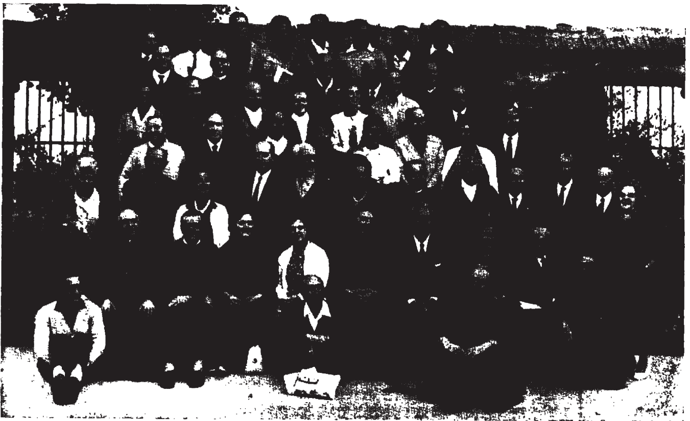
Participantes al Plan de Renovación Conciliar

Tenemos que despojarnos de ideas y de prejuicios, de formas de expresión o de lenguaje que no responden a la mentalidad