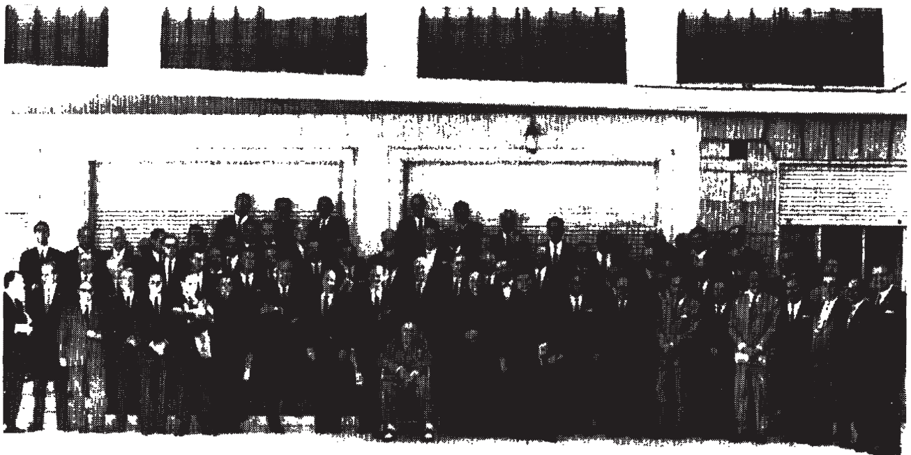
Grupo de Propagandistas asistentes a la LIII Asamblea General