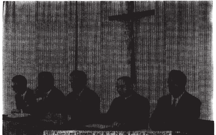
III Asamblea General de A. C. N. de P. en la Peña

3.- La participación en los órganos de gestión y dirección, siempre que existan en la Empresa eficaces sistemas de control, no debe tener carácter representativo, ya que se trata de una cuestión técnica, siendo suficiente con que las personas que desempeñan estas funciones tengan rectitud moral y competencia humana y profesional puesta al ser-