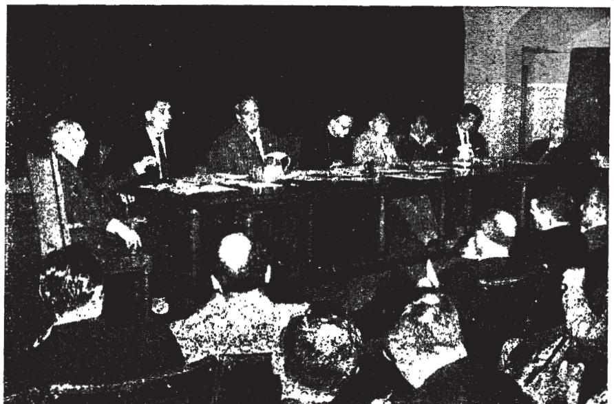
Mesa presidencial de la LV Asamblea de Secretarios, celebrada en Madrid, en el Colegio Mayor de San Pablo, el día 21 de septiembre