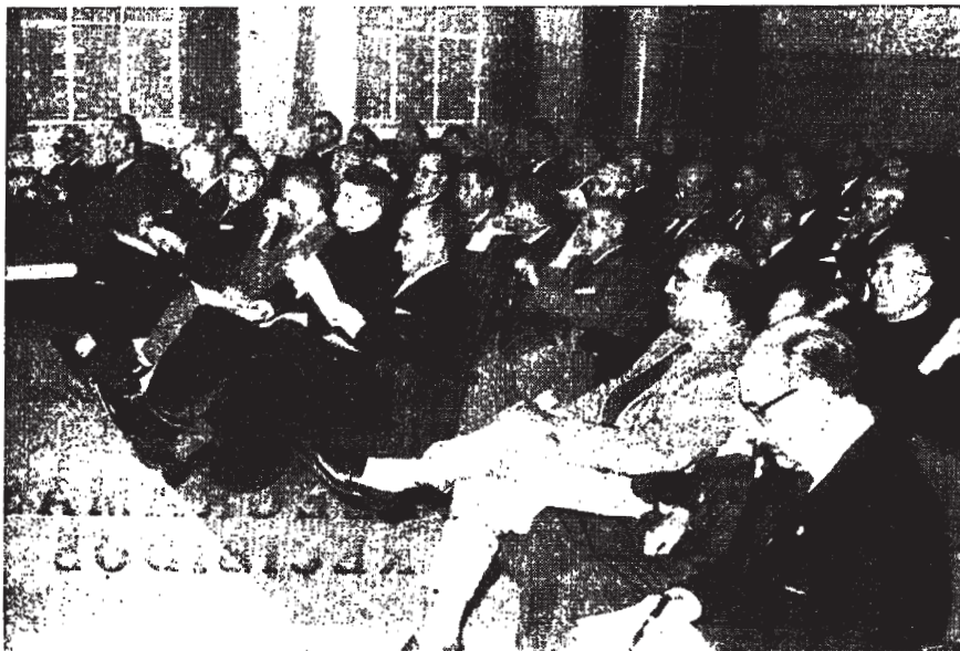
Vista parcial de los asistentes a la LV Asamblea de Secretarios

ragona en las primeras horas de la tarde, el consiliario nacional, doctor Castán, anticipó su intervención, que figuraba al final de la Asamblea, y la sintetizó en unas palabras de despedida y espera. "Os espero—dijo—en Tarragona, adonde vais a acudir en peregrinación a venerar el brazo activo del Apóstol San Pablo. Subrayo lo de activo para que penséis que debéis ir allí a ofrecerle obras. Como la de ese Colegio de Graduados en proyecto y también la de una escuela de formación profesional, que tanta falta hace." Después de impartir su bendición, abandonó el salón.