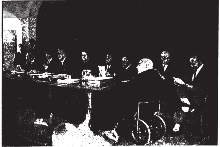
Presidencia de la L Asamblea General de la Asociación, celebrada en el Colegio Mayor de San Pablo el domingo 22 de septiembre