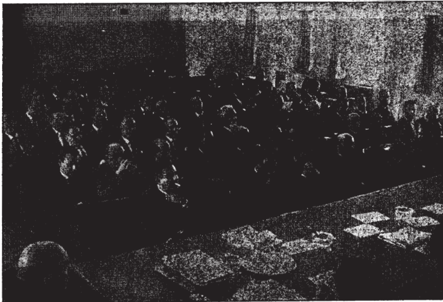
Vista parcial de los asistentes a la L Asamblea General de la Asociación