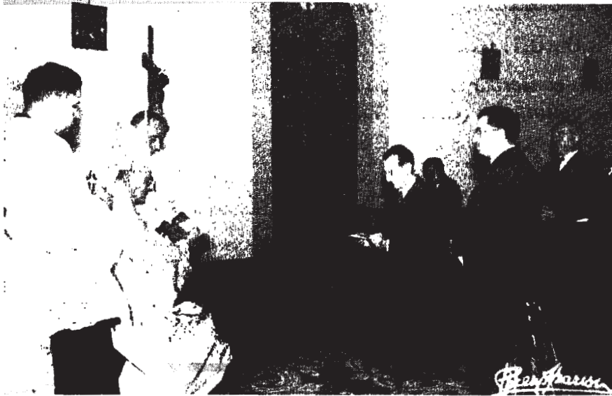
Un momento de la renovación de promesas en el Centro de Valencia, con asistencia del Presidente de la Asociación