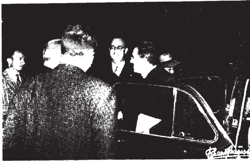
Llegada a Valencia del Presidente de la Asociación

El Presidente expuso a continuación las dos preocupaciones de tipo nacional en orden a las campañas del Bien Común y del Mundo Mejor. Aportó toda la experiencia de los grupos que trabajan en la primera de estas campañas y sugirió cuán interesante es que en cada Centro se forme un pequeño núcleo que trabaje con el de Madrid; a tales efectos recomendó la colección del bien común. Sobre la Campaña del Mundo Mejor inte-