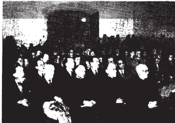
Aspecto que ofrecía el salón de actos del Instituto de Estudios Ilerdenses en la sesión inaugural del curso de Deontología Profesional