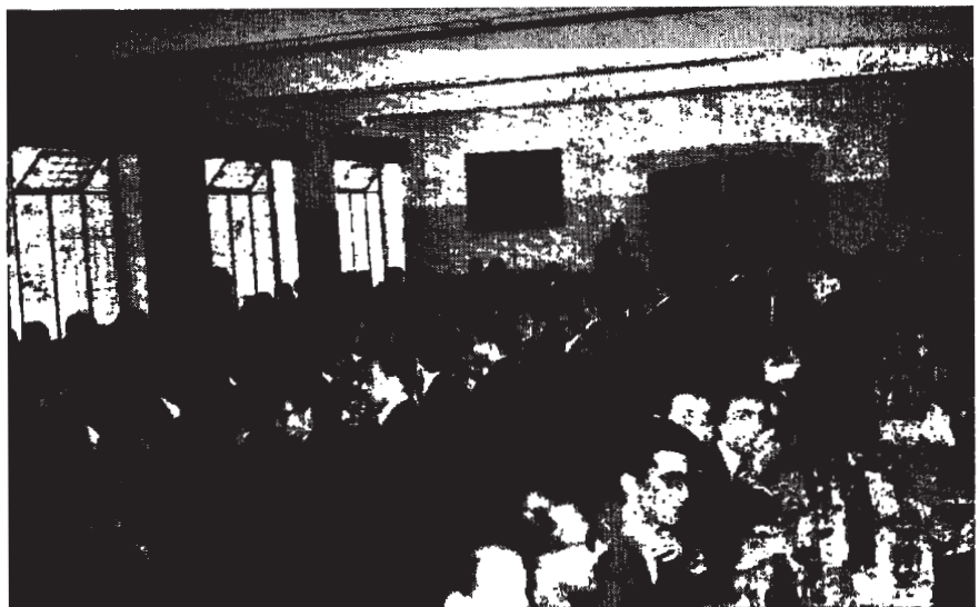
Los directivos y estudiantes del Colegio Mayor Universitario de San Pablo ofrecieron una comida al ministro de Educación Nacional

A la España que hay que servir es a la España entera y total, sin sectarismos de derecha e izquierda, en un afán sincero de servir a la justicia.