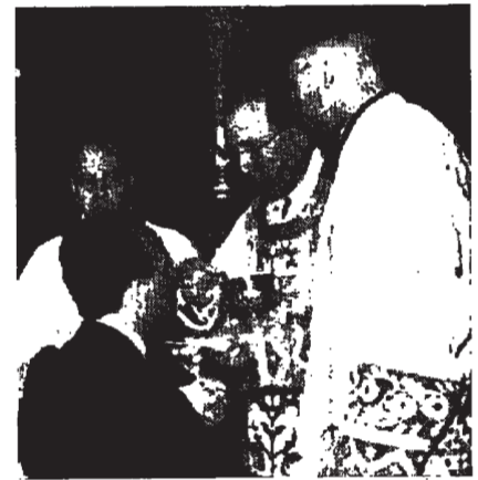
El excelentísimo señor ministro de Educación Nacional recibe la sagrada comunión en la capilla del Colegio Mayor el día de Santo Tomás de Aquino