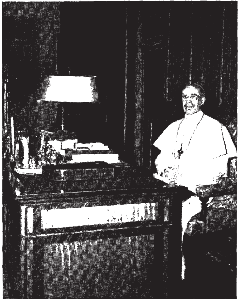
Su Santidad el Papa en su biblioteca privada.