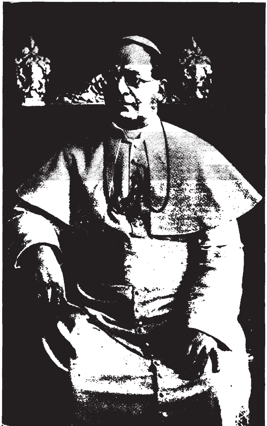
Su Santidad Pío XI, que abrió la Puerta Santa los años 1925 y 1933

sus deberes sociales y políticos y, lo que es hoy muy importante, de sus deberes para con la Iglesia. Por eso es característica de las Juventudes Católicas aparecer unidas, íntimamente unidas a toda la jerarquía: desde los párrocos—sabido es que las organizaciones modelo son parroquiales—hasta el Romano Pontífice, pasando por los Obispos. "Pensar con el Papa, sentir con el Papa, querer con el Papa", según deseo de Benedicto XV expresado a los jóvenes católicos. La Juventud Católica, así organizada, al unir los miembros con la cabeza, renueva y refuerza la autoridad moral y la eficacia de la Santa Sede y de la Iglesia católica para dirigir la sociedad. Es, sin duda, la gran institución de nuestros días, porque además en ella ha arraigado perfectamente el carácter internacional propio de nuestros tiempos."