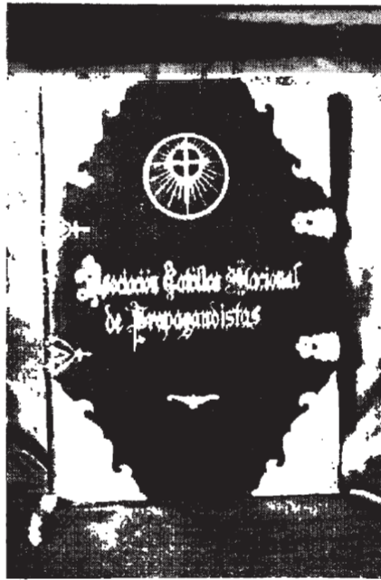
El artístico y valioso álbum con los nombres de los mártires de la Asociación depositado en el santuario de la Gran Promesa

¡Qué espectáculo tan hermoso, qué espectáculo tan consolador veo yo no ya con los ojos de la cara, sino con los ojos de la imaginación, iluminada con las luces de la fe, al advertir que de toda España en estos momentos suben ríos de amor al Corazón sacratísimo del Rey divino de varios, de muchos