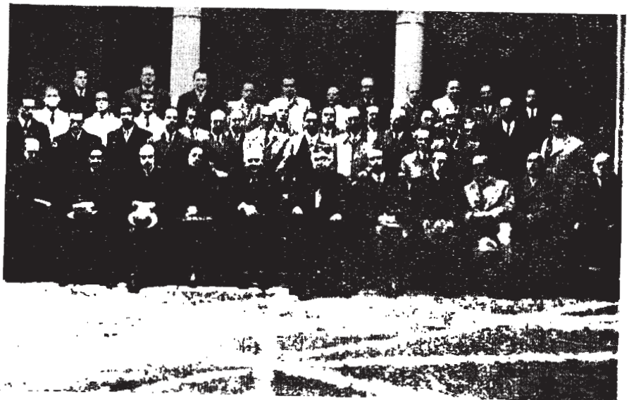
Después del acto celebrado en el Santuario Nacional de la Gran Promesa, los propagandistas con el presidente visitaron al excelentísimo señor Arzobispo de Valladolid