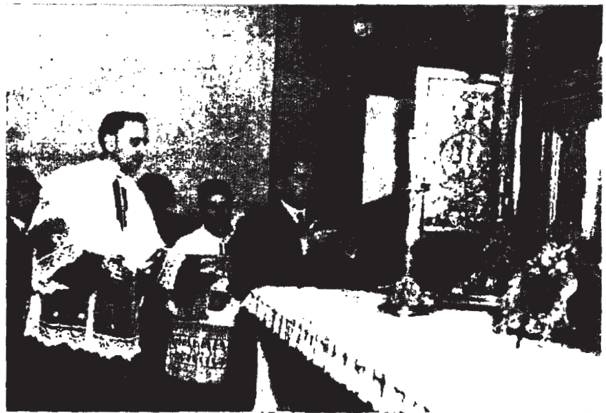
Momento en que es depositado el álbum en la predela del altar de los Mártires de Cristo Rey

Otra idea, la segunda de esta segunda parte, es que en la consagración habéis dicho al Corazón sacratísimo de Jesús que queréis ser soldados suyos. ¡Soldados de Cristo a imitación de San Pablo! Muy bien. Pero, ¿con qué armadura? Ahora, cuando se habla de armamentos, se habla de cañones, fusiles, ametralladoras, gases asfixiantes, bombas atómicas. ¡Y así vamos a establecer la paz! Por ese camino no vamos a la paz. Vamos a la guerra eterna hasta la consumación de los tiempos. ¿Qué armadura ha de ser la vuestra? Si es a imitación de San Pablo, armaos con las armas de la luz, y a ellas unid, ya lo dice en otro pasaje, cuáles sean las armas principales: la compasión y la misericordia. La misericordia de las miserias de la vida corporal; la mise-