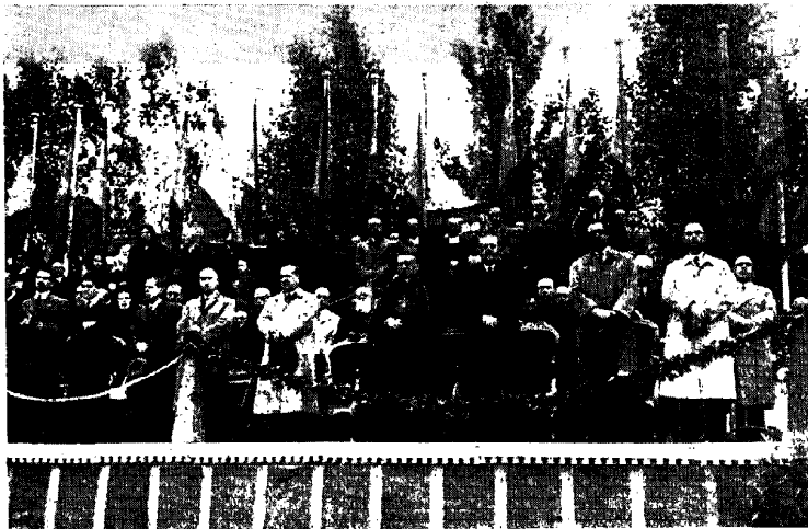
Una de las presidencias del acto de Madrid, formada por el Nuncio de Su Santidad, Presidente de las Cortes y otras personalidades

Además de todos estos actos, cada Rama de Acción Católica ha organizado otros muy solemnes: peregrinaciones, juramento mariano, editado revistas especiales, etc.