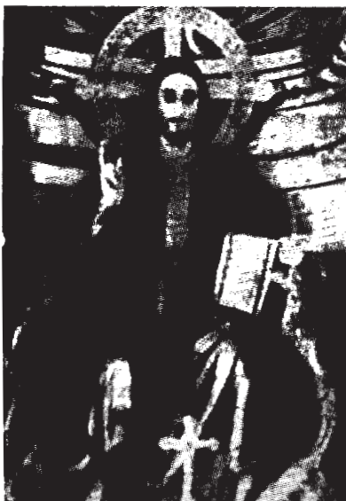
Imagen de Cristo Rey que preside el altar de la capilla de la Casa de San Pablo cuya festividad celebró el Centro de Madrid con una solemne vigilia eucarística. Al renovar nuestra consagración postrados ante su altar, le dijimos que suyos somos y suyos queremos ser y le pedimos que otorgue a todos los pueblos la tranquilidad en el orden para que del uno al otro confín de la tierra no resuene sino esta voz: "Alabado sea el Corazón divino, causa de nuestra salud; a El se entonen cánticos de honor y de gloria por los siglos de los siglos."