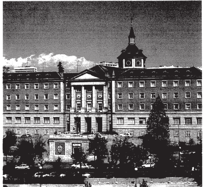
Sede de la Asociación Católica de Propagandistas

La Asociación Católica de Propagandistas está distribuyendo carteles y estampas sobre la vida del Siervo de Dios Angel Herrera. Si estás interesado en tener información sobre estos documentos distribuidos puedes llamar a la Sede de la Causa y dejar tu