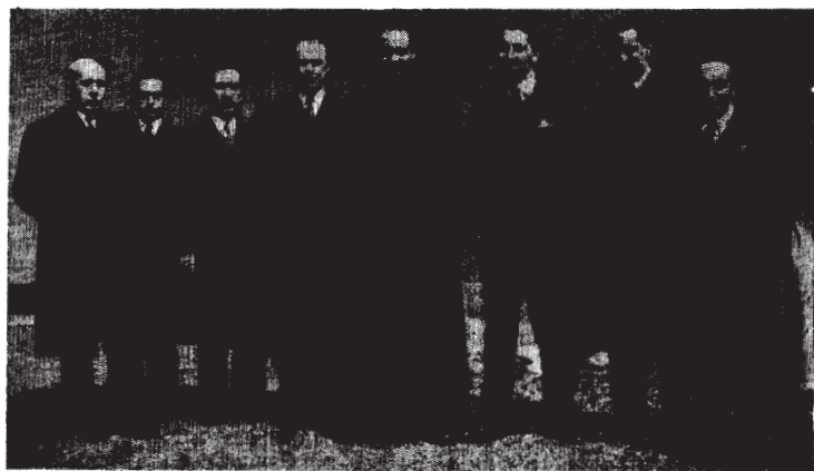
Propagandistas de Bilbao al salir de la Hora de Adoración

Los compañeros de este incipiente Centro celebraron la Hora de Adoración en unión de la Juventud Católica y Adoración Nocturna de dicha ciudad, en la noche del domingo, primero del co-