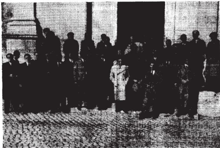
Los Propagandistas, concluida la Misa de Comunión, salen de la Basílica de San Pablo, en Roma

A continuación se reunieron a desayunar los propagandistas en un café próximo a la Basílica, acordándose en-