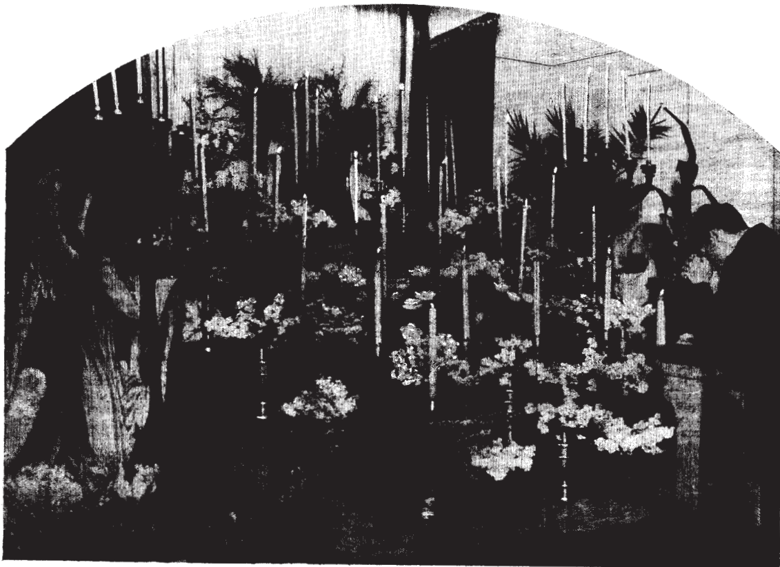
El «Monumento» del Jueves Santo en la Capilla de la Casa de San Pablo, del Centro de Propagandistas de Madrid

¡Aleluya! Cristo ha resucitado, y a través de las piedras frías del sepulcro de José de Arimatea, iba a florecer un día la semilla de nuestra Asociación, para esparcir a voleo por España y por el mundo los gérmenes eternos del Cristianismo, fecundados al sol de la Resurrección.