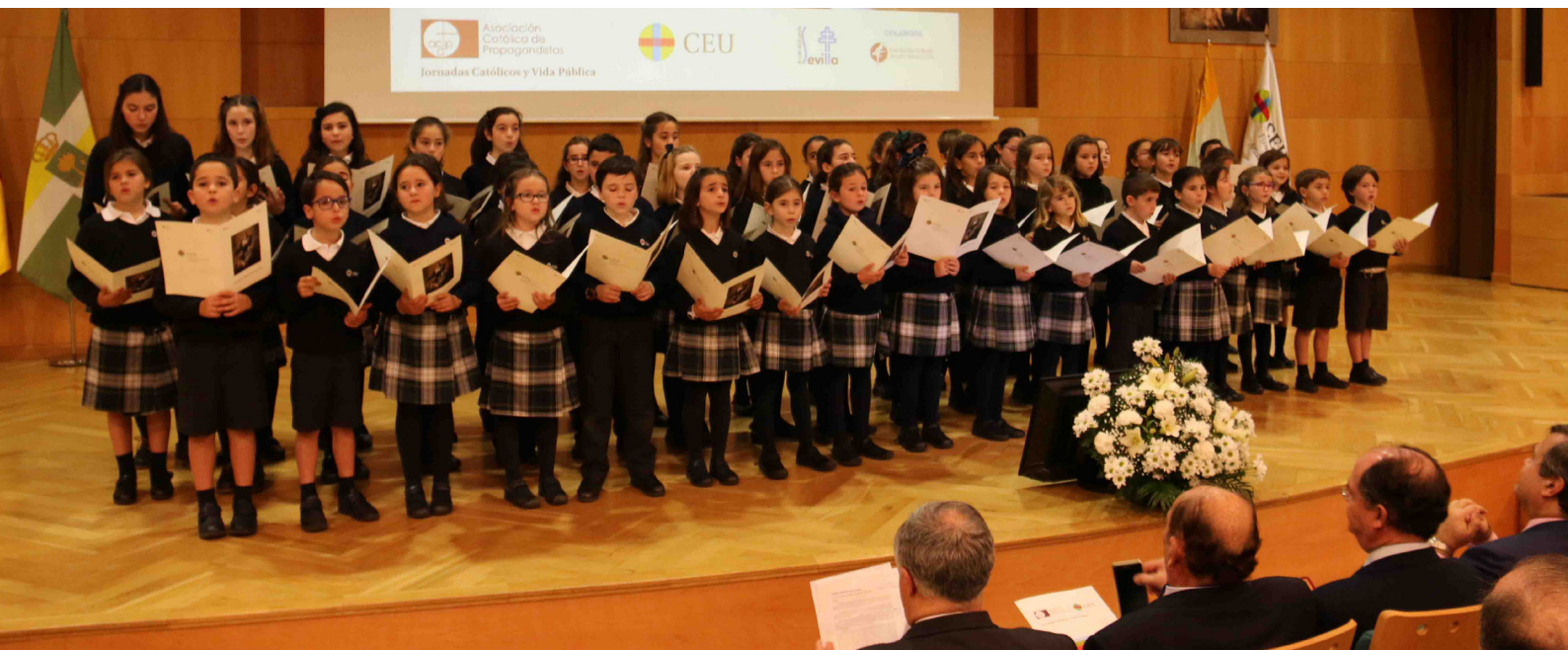
Coro del Colegio CEU San Pablo Sevilla