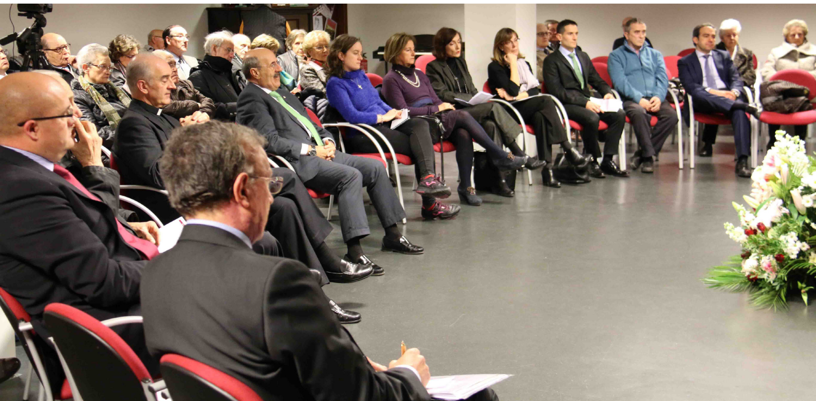
Grupo de asistentes a las Jornadas de Pamplona.