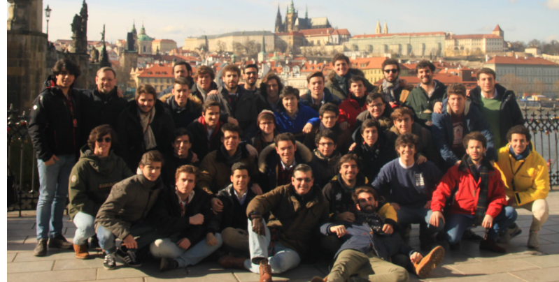
IZQ. Excursión anual por tierras de España (Ávila, 2016). DCHA. Viaje a Europa (Praga, 2016).