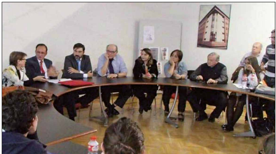
Los participantes en las Jornadas siguen con atención una de las ponencias.