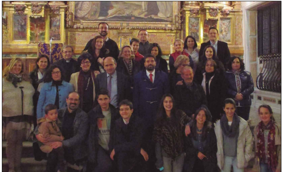
Asistentes a la convivencia en Toledo.