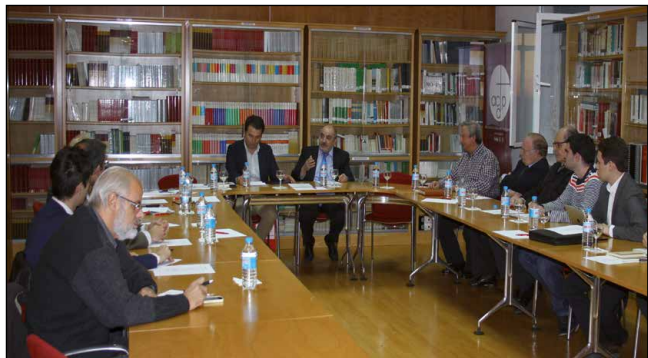
Asistentes al Círculo de Crítica Política del Centro de Madrid.