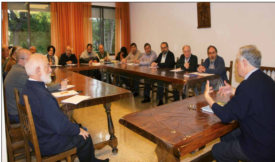
Director y ejercitantes durante una de las meditaciones.