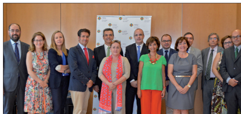
La nueva Junta de Gobierno de la Universidad CEU San Pablo.