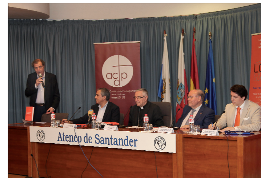
Un momento de la presentación del libro en el Ateneo de Santander.