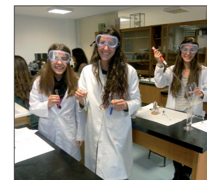
ARRIBA, los alumnos del Colegio CEU San Pablo Montepríncipe desarrollan actividades solidarias; ABAJO, alumnos durante las prácticas en el laboratorio.