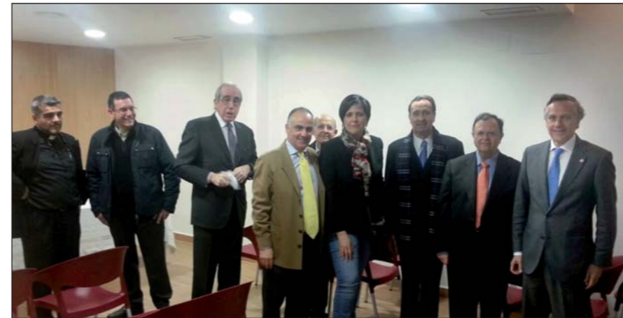
Fotografía de grupo de los asistentes a la inauguración de la nueva sede en Castellón.