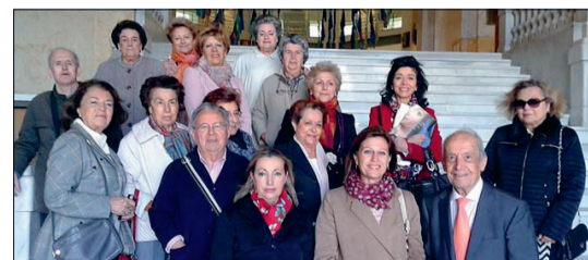
El pasado 12 de mayo el Aula Arte, Fe y Cultura visitó la Bolsa de Madrid (arriba). Por otra parte, también realizó una visita a la colección Masaveu del Centro Cibeles en Madrid (abajo), para ver la exposición titulada: 'Imagen y Materia: Del Románico a la Ilustración'.