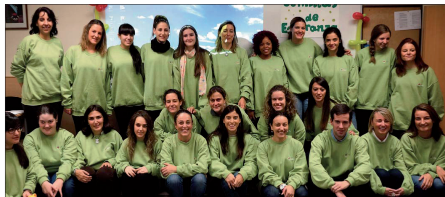
ARRIBA, la visita del Cardenal Antonio María Rouco al Congreso, y los niños preparando la obra de teatro que se representó la tarde del sábado. ABAJO, los voluntarios que participaron en el Congreso Infantil.

Más información en... http://ceumedia.es