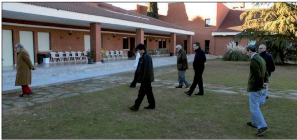
ARRIBA, un momento que se repitió todos los días de los Ejercicios: el rezo del Rosario.

Dios, pero también deformarse con los efectos que son consecuencia de nuestros propios pecados.