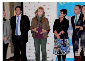
La eurodiputada Pilar del Castillo durante el acto de inauguración de la flamante sede del CEU en Bruselas.