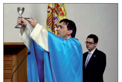
Los Centros celebraron la festividad de la patrona de la ACdP, la Inmaculada Concepción. En Madrid, la Eucaristía estuvo presidida por el vicesecretario nacional.

También se anunció que la próxima reunión del Consejo nacional tendrá lugar el sábado 15 de enero de 2014 y que en ella se estudiará el documento titulado 'Fines de la Asociación Católica de Propagandistas y su cumplimiento en los centros docentes', elaborado por una comisión nombrada en su día por el presidente.