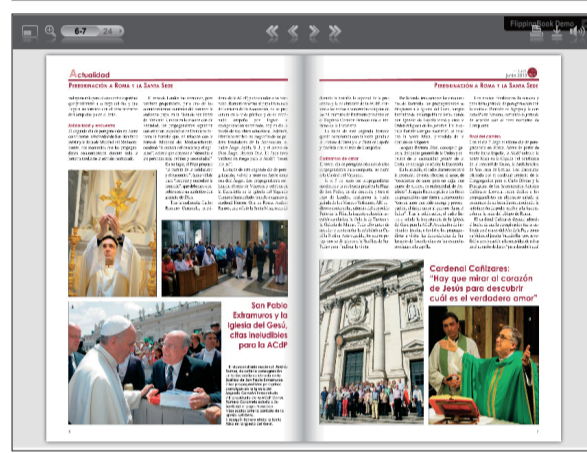
El boletín interactivo supone un paso más de la ACdP en las Nuevas Tecnologías.