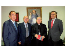
Los socios del Centro de Alicante realizaron el 7 de noviembre una visita al nuevo obispo de la diócesis de Orihuela-Alicante, monseñor Jesús