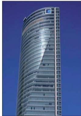
Los participantes iniciarán el Ciclo en la Capilla de la emblemática Torre Espacio del Paseo de la Castellana.

Los socios inscritos en este Ciclo tendrán la ocasión de disfrutar de ocho visitas guiadas, en algunos casos privadas, a lugares y edificios emblemáticos de Madrid como la Torre Espacio (que alberga la Capilla situada a mayor altura de España), el Barrio de Las Musas y la Casa Museo de Lope de Vega, el Palacio del Senado, el Museo de la Fundación Manuel Benedito, el Museo Nacional de Artes Decorativas, el Monasterio de las Salesas Reales, el Palacio de la Bolsa de Madrid y, finalmente, el entorno de la Puerta del Sol, kilómetro cero de España. □