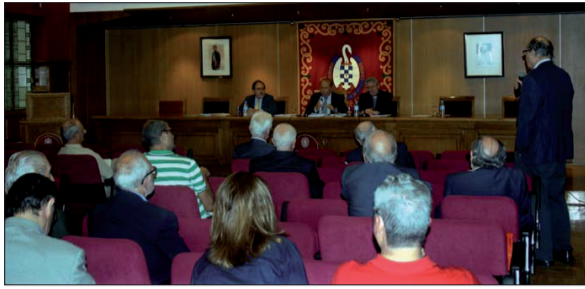
Intervención de uno de los socios durante la celebración de la Asamblea.

Nada más comenzar, el secretario del Centro explicó que el documento se había enviado previamente a todos los socios del Centro por correo electrónico y por correo postal para que pudiera ser leído con detenimiento.