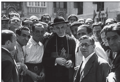
IZQUIERDA Don Ángel rodeado de sus feligreses malagueños. ABAJO El siervo de Dios —a la derecha, en un púlpito improvisado— se dirige a un numeroso grupo de obreros en unas cocheras.

Siendo ya obispo de Málaga, desplegó una ingente actividad social con la construcción de barrios enteros para los trabajadores, como el de Carranque, en cuyo centro se levanta la iglesia de San José Obrero. Qué decir de la inmensa obra de las escuelas-capilla rurales con las que se redujo drásticamente el analfabetismo entre los campesinos malagueños, con la oposición de buena parte de los terratenientes. Conviene recordar que, por entonces, se le llegó a denominar el “obispo rojo”, “el obispo socialista” o el “líder del ala izquierda de la Iglesia”. Se equivocaban entonces, como ocurre ahora.