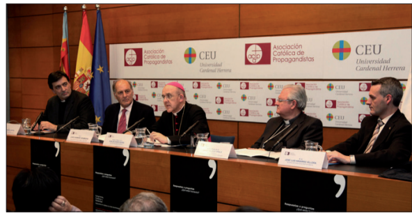
IV Jornadas de Valencia: intervención del arzobispo, monseñor Carlos Osoro.

Durante este curso, los ciclos se han celebrado en lugares ya veteranos en esta acogida, como Sevilla, Jerez de la Frontera, Bilbao o Valencia; y en nuevas ciudades que han recibido su primera edición con los brazos abiertos, ya sea Badajoz, Cuenca o Guadix. El director de las Jornadas Católicas y Vida Pública, destaca el trabajo y la ilusión por parte de las diócesis, mesas, coloquios y la organización de estas tres últimas localidades, que no cuentan con centros de la ACdP, como es el