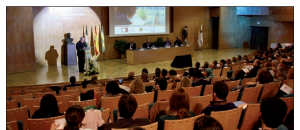
ARRIBA: IV Jornadas en la Diócesis de Alicante; CENTRO: Santa Misa durante las ya consolidadas Jornadas de Jerez de la Frontera; ABAJO: La VI edición de Sevilla.