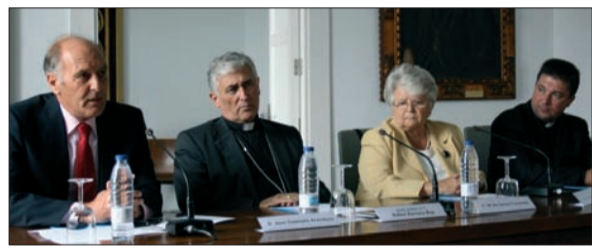
El obispo de Cádiz y Ceuta, Rafael Zornoza Boy, presidió la mesa inaugural en Cádiz.

"Todas las diócesis nos han apoyado mucho"