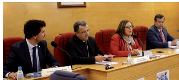
El obispo de Guadix-Baza monseñor Ginés García, en el acto de inauguración.

La I Jornada Católicas y Vida Pública de Cuenca se celebró bajo el título "Los laicos, protagonistas de la Nueva Evangelización". Fieles a la doctrina y al Año de la Fe, los participantes reunidos en el Centro Cultural