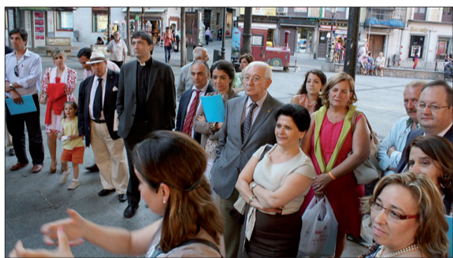
Los asistentes a las Jornadas participaron en el itinerario por Toledo ‘Las huellas de la fe’.

El profesor Peña centró su exposición en el cumplimiento del punto 13 de la Carta Apostólica Porta Fidei : “A lo