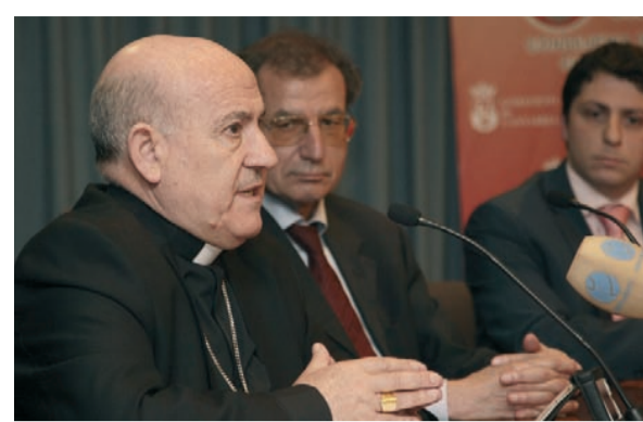
El obispo de Santander en un momento de su conferencia en el acto de clausura.

Antes de acabar la charla, el obispo tampoco se olvidó de los seglares e hizo especial hincapié en que el Concilio Vaticano II también "evita una concepción aislacionista del primado" porque "la colegialidad del episcopado revaloriza el ministerio del