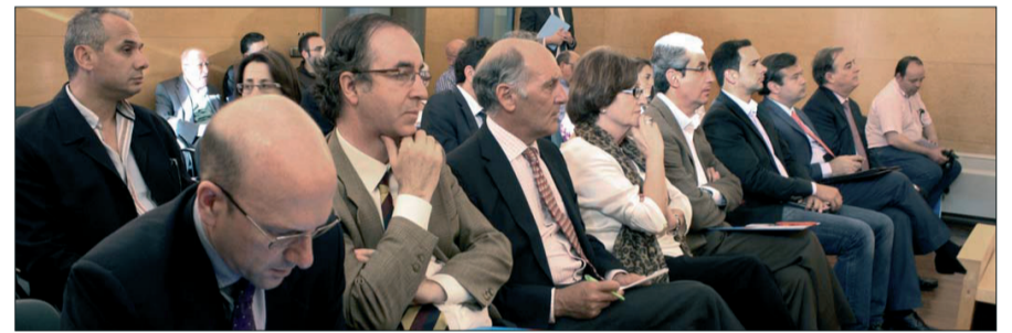
El público asistente a las Jornadas siguió con interés cada una de las ponencias.