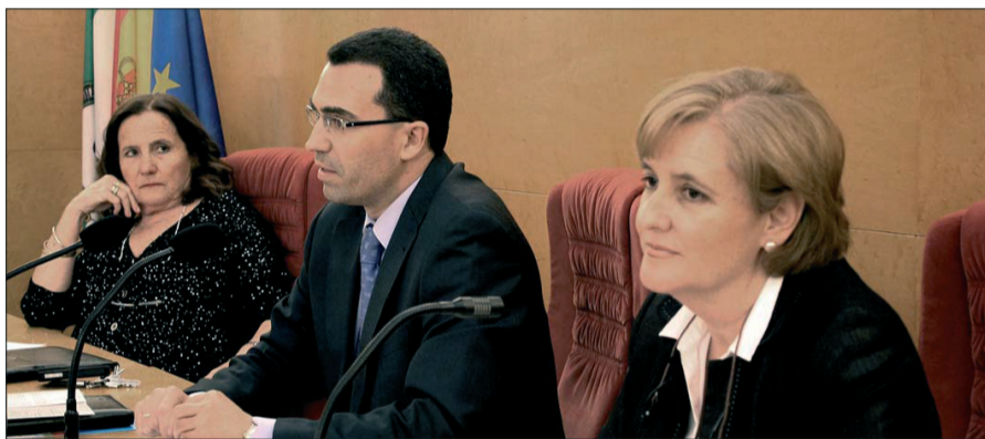
Primera mesa redonda de las Jornadas en la que se analizaron los desafíos éticos de la actividad económica.

El público asistente a las Jornadas siguió con interés cada una de las ponencias.