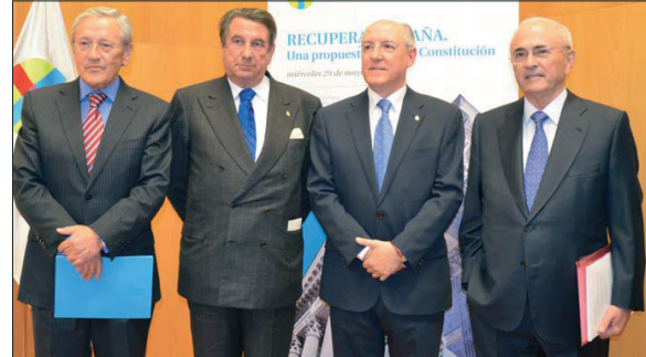
Fernando Ónega, Francisco Vázquez, Carlos Romero y José Manuel Otero Novas.

Los miembros del Aula Política, think tank compuesto por personas con preo-