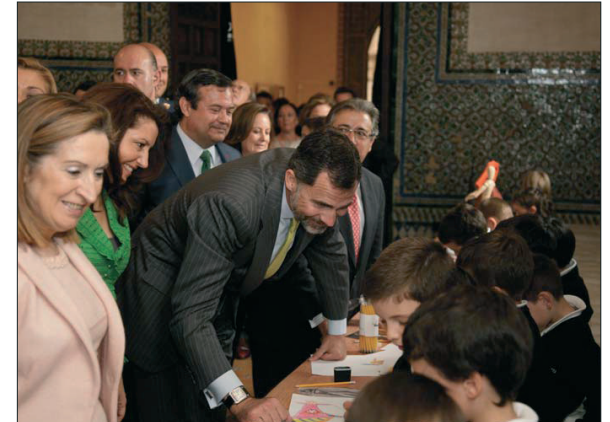
Los niños mostraron sus trabajos al Príncipe Felipe y la ministra de Fomento, Ana Pastor.

Los niños, acompañados por sus profesores y por la dirección del centro, hicieron un recorrido didáctico por el edificio y por la muestra que reúne diecisiete obras maestras del pintor extremeño. Además, inauguraron los talleres infantiles sobre diseño de alta costura, y mostraron a los Príncipes Felipe y Letizia sus primeras realizaciones.