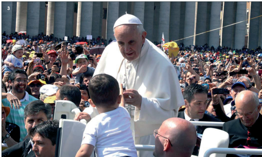
1 Carlos Romero y Antonio Rendón-Luna saludan al cardenal Antonio Cañizares Llovera. 2 El cardenal durante la homilía en la Catedral de Roma. 3 El Papa Francisco se detuvo en su recorrido a la altura de los propagandistas.

Más información en... http://ceumedia.es