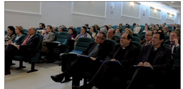
El público asistente atendió con interés a estas primeras Jornadas.