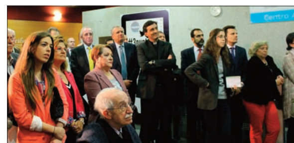
La exposición congregó a un gran número de asistentes de todas las edades.