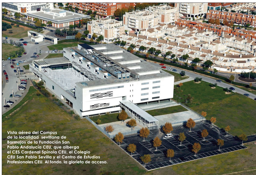
Vista aérea del Campus de la localidad sevillana de Bormujos de la Fundación San Pablo Andalucía CEU, que alberga el CES Cardenal Spínola CEU, el Colegio CEU San Pablo Sevilla y el Centro de Estudios Profesionales CEU. Al fondo, la glorieta de acceso.