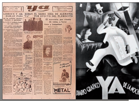
A la izquierda, el cartel de la exposición y sobre estas líneas el primer número del Ya y un cartel anunciador de este diario. A la derecha, la portada del semanario Digame y debajo un reportaje sobre la agencia Logos. Abajo, a la izquierda, inauguración de la rotativa en la sede de Alfonso XI el 12 de febrero de 1934 y la sala de rotativas de la sede de Mateo Inurria.