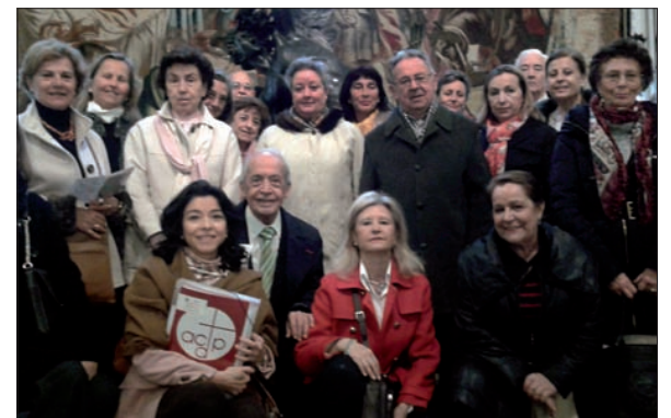
Los miembros del Aula Arte Fe y Cultura del Centro de Madrid durante la visita.

En 1752 se inauguró la Real Academia de Bellas Artes de San Fernando en el Salón de la Casa de la Panadería en la Plaza Mayor, hasta encontrar un edificio mayor en 1773 ubicado en la Calle Alcalá, construido por el célebre Churriguera. Más tarde le dió un aire neoclásico Villanueva por orden de Carlos III. En 1774 quedó inaugurada, imponiendo un nuevo orden de arquitectura y de ciudad, de las artes plásticas, al tiempo que se reestructuraba la Administración de España y América, del Ejército regular, marcando las