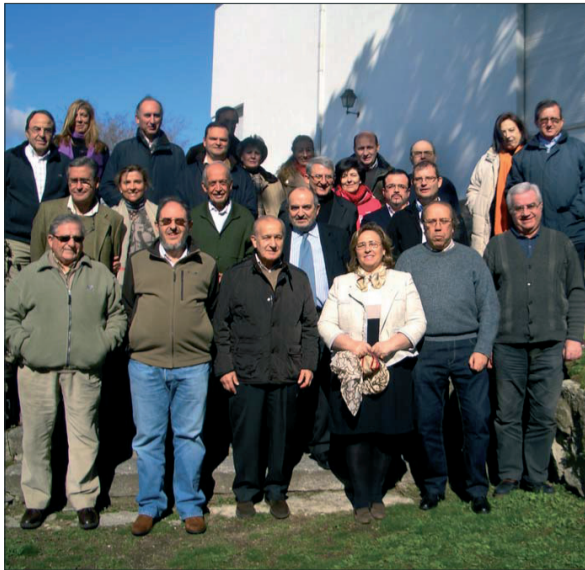
Asistentes a los ejercicios espirituales organizados por el Centro de Madrid.

En segundo lugar, la respuesta al drama del sufrimiento y del dolor. El amor vence al odio, por lo que la alegría de vivir es superior al tedio, la tristeza y, entre otros, a la desesperanza. Frente a todas las cosas adversas, Cristo se compromete con quienes sufren porque, si bien todos los problemas humanos no tienen solución y el mal que azota al hombre tiene raíces profundas, solamente po-