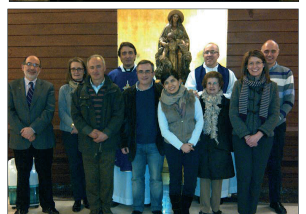
DE ARRIBA A ABAJO, el viceconsiliario nacional en su visita los Centros de Valladolid, Málaga y Santiago de Compostela.