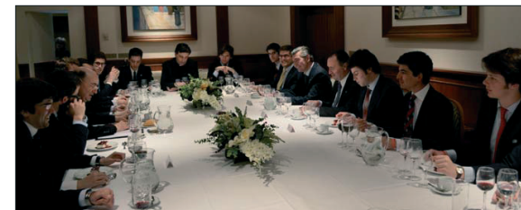
Los colegiales tuvieron un animado coloquio con el consiliario nacional.