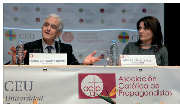
Pedro Schwartz Gilón y Adela Aura de Larios durante la segunda ponencia.

La segunda sesión de las jornadas contó con la intervención de Pedro Schwartz, académico de la Real Academia de Ciencias Morales, quien aseguró que "el momento actual, siendo malo, no es el peor que ha sufrido España... pero necesitamos una regeneración". Según Pedro Schwartz, el mayor problema es la corrupción: "Esta crisis implica unos males peores que el déficit económico y uno de