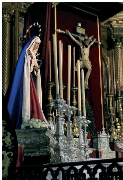
Los propagandistas disfrutaron de un recorrido artístico y espiritual en la iglesia de San Miguel.