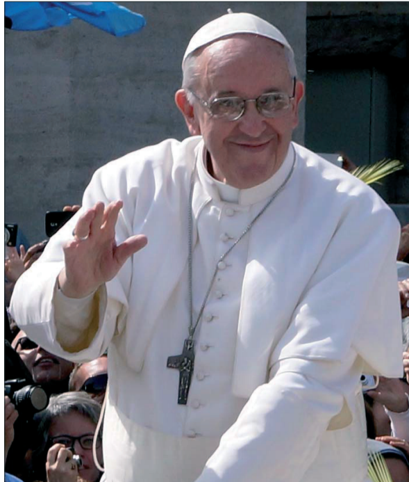
Su Santidad el Papa saluda a los fieles en la Plaza de San Pedro.

¿Tiene sentido tratar de cambiar esto?, pero ¿cómo, Padre? ¿No será que nosotros tenemos que reconciliarnos con Dios?; ¿tendrán la suficiente armonía interior?; ¿cuáles son tus secretos, Padre? Algunas de estas preguntas precedían las homilias del arzobispo Jorge Bergoglio, que veremos a continuación, en relación con la primera liturgia del sucesor de Pedro.