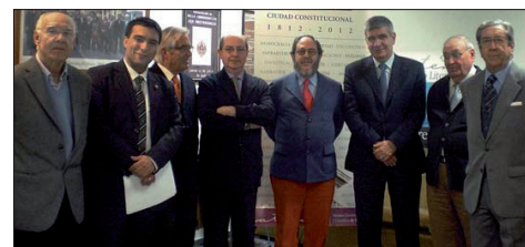
En el centro, el ponente junto a las autoridades y algunos propagandistas.