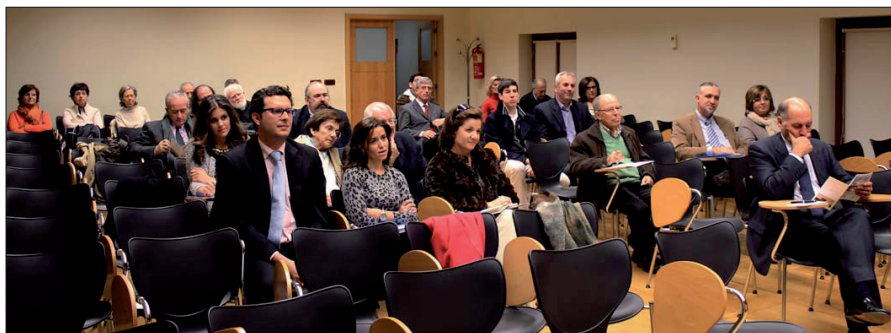
El público asistente a las Jornadas siguió con interés el testimonio ofrecido por los ponentes.