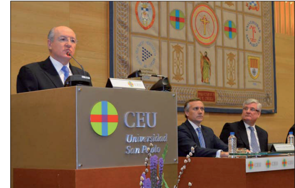
El presidente de la Fundación Universitaria San Pablo CEU durante su intervención.

Por otro lado, la institución reconoció la labor de dedicación, esfuerzo y compromiso, tanto del personal docente como del de administración y servicios con la entrega de placas a aquellos que cumplieran 25 años de trabajo en sus diversos centros.