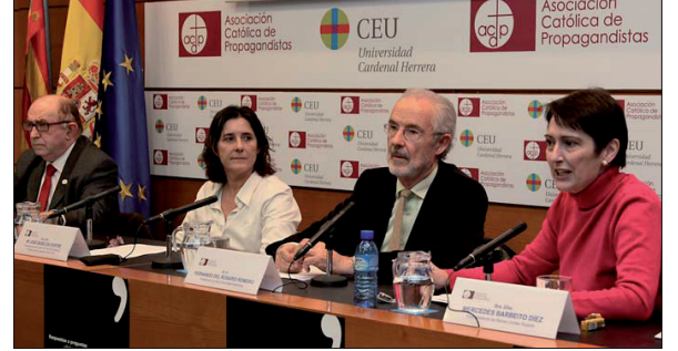
ARRIBA, imagen de la sala durante la sesión del viernes; ABAJO, la primera mesa redonda en la que se habló de la solidaridad como respuesta a la crisis.

Del Rosario señaló que el voluntariado "constituye un elemento básico para la canalización de la solidaridad que mejora y fortalece la participación social, transformando el entorno en más justo e igualitario". En este sentido, se refirió a la participación del voluntariado en los programas sociales de Cruz Roja Española, que es uno de los motores básicos del llamamiento de ayuda 'Ahora + que