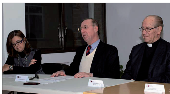
ARRIBA, los propagandistas de Cáceres junto al vicesecretario nacional y al secretario general; ABAJO, un instante de la conferencia del vicesorero.

tica, desde la Segunda República hasta nuestros días, y por último la presencia de la Asociación en el mundo cultural y universitario con la Fundación Universitaria San Pablo CEU, con tres universidades privadas y numerosos centros de enseñanza y colegios por toda España; la Fundación Abat Oliba, la Fundación San Pablo