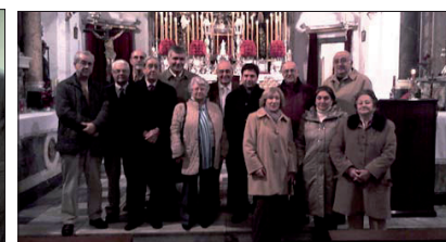
Los socios de Cádiz en la iglesia de San Pablo.