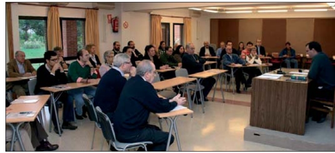
Los Ejercicios Espirituales celebrados en la Casa de los Padres Cooperadores Parroquiales de Cristo Rey conlaron con una nutrida asistencia de socios venidos de los Centros de Alicante, Castellón, Gafate, Madrid y Talavera de la Reina.

quiere de valentía, porque tenemos que “morir a nosotros mismos” para vivir a la vida del Espíritu. La jornada del sábado concluyó con el rezo de las vísperas, la cena y la vigilia de oración en la Capilla de la Casa de Ejercicios.