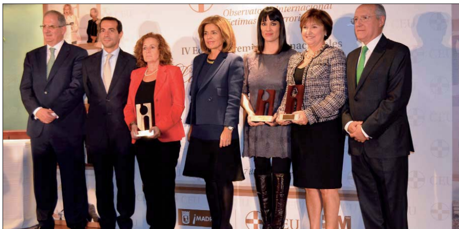
Los galardonados, junto al presidente de la Asociación, las autoridades y los organizadores del premio 'Puerta del Recuerdo'.