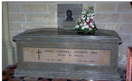
Tumba de Ángel Herrera Oria en la Catedral de Málaga.

alumbre en la tiniebla, verdadera sal de la tierra, verdadera buena semilla capaz de morir y dar fruto abundante. Solo si se busca la Verdad con sincero corazón, la Verdad que nos hace libres, evitando la tentación de alcanzar el bien haciendo el mal, y de disfrazar de verdad lo que es mentira, podremos ayudar en la nueva evangelización. Aunque ello nos cueste el sacrificio de la cómoda instalación en lo que es políticamente correcto, o nuestra propia popularidad (“pues Yo es digo que no será así entre vosotros”. El que quiera ser el primero que sea vuestro servidor”), concluyó.