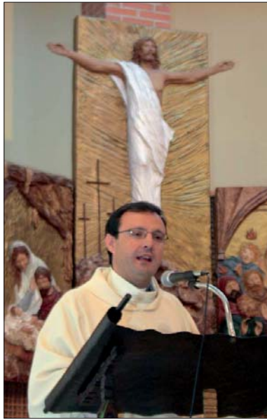
Homilía del director de la tanda en una de las Eucaristías.

Para seguir la senda de Jesucristo hay que poner en práctica cuatro verbos: escuchar, seguir, servir y dar la vida. “Ser cristiano -señaló el sacerdote-, re-