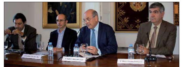
ARRIBA, los participantes de la mesa redonda ‘Las edades de la fe’; CENTRO, los conferenciantes de la mesa redonda ‘Los jóvenes y la transmisión de la fe’; ABAJO, los ponentes de ‘Los retos de la fe en el nuevo milenio’.