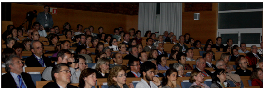
ARRIBA, el cardenal Rouco Varela visita el mini congreso infantil; ABAJO, los congresistas en una de las sesiones celebradas en el Aula Magna de la Universidad.