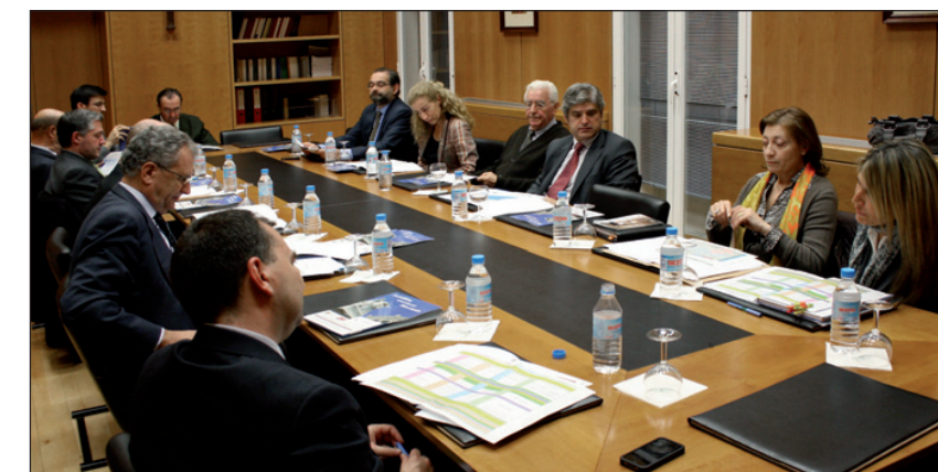
Una de las reuniones preparatorias del XIII Congreso Católicos y Vida Pública.

La grave crisis económica que afecta especialmente al mundo occidental ha llevado a amplias capas de la población a situaciones de paro y de penuria a las que es urgente dar respuesta a la vez que se