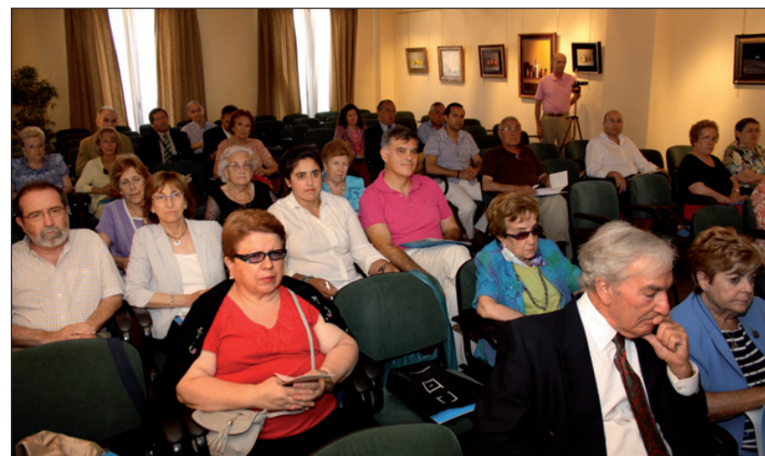
La Real Hermandad de Nuestro Padre Jesús del Santo Sepulcro acogió las Jornadas.