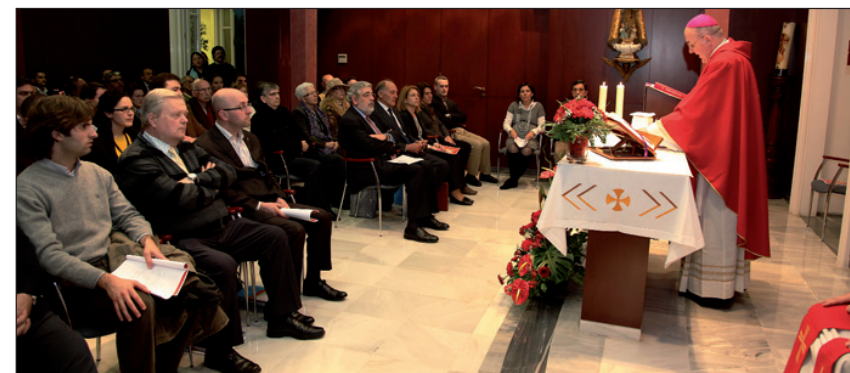
ARRIBA, los niños disfrutaron de las actividades organizadas en las Jornadas de Sevilla; ABAJO, la celebración de la Eucaristía durante las Jornadas de Valencia. IZQUIERDA, el díptico de convocatoria de las Jornadas de Guadalajara.