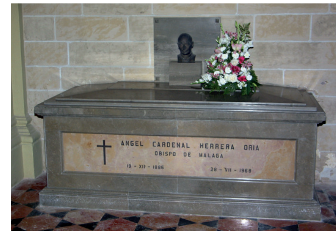
Tumba de Ángel Herrera Oria en la catedral de Málaga.