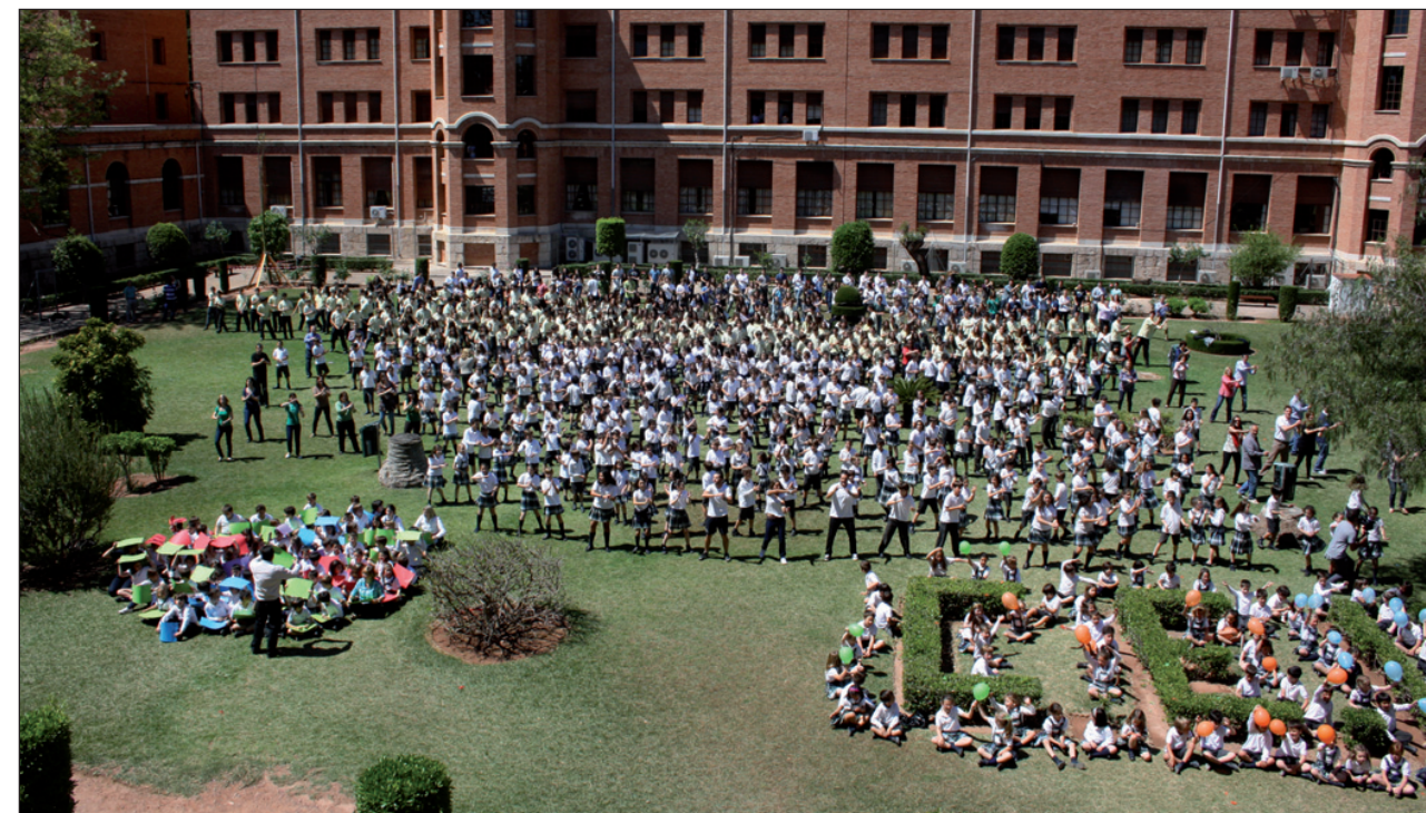
Una escena del lipdub grabado para conmemorar el cuadragésimo aniversario del Colegio CEU San Pablo de Valencia.

Valencia | REDACCIÓN El viernes, 11 de mayo, el Colegio CEU San Pablo de Valencia conmemoró su cuadragésimo aniversario con la presentación de un lipdub grabado para la ocasión. En el vídeo musical participaron con enorme ilusión todos los alumnos y profesores del colegio, personal de biblioteca, monitores, cocineros y miembros del equipo de administración y limpieza, intentando expresar todo lo que se hace en el colegio para plasmar la trayectoria de sus 40 años. En el acto de celebración del aniversario estuvieron presentes los cerca de mil alumnos del colegio, junto a profesores, personal, padres y antiguos alumnos.