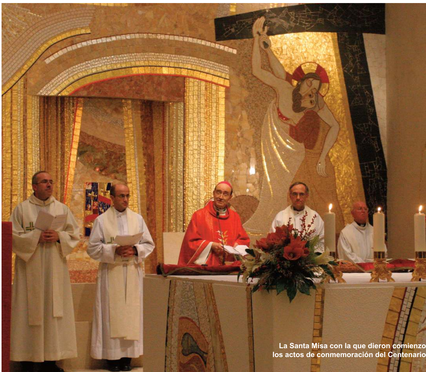
La Santa Misa con la que dieron comienzo los actos de conmemoración del Centenario

La Santa Misa en la recién restaurada capilla del Colegio Mayor de San Pablo, la inauguración oficial de la exposición que se puede visitar en el claustro, y las ilustrativas ponencias del día 4 de di-