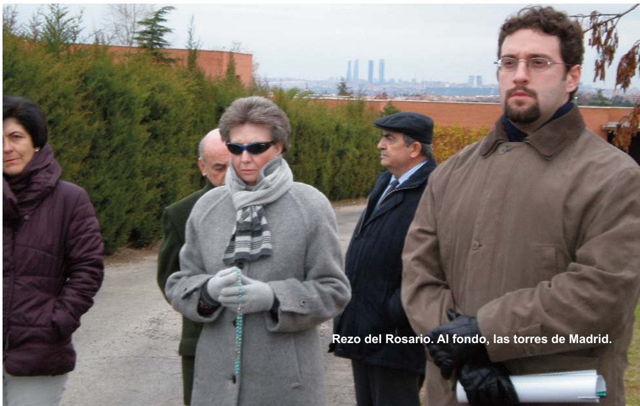
Rezo del Rosario. Al fondo, las torres de Madrid.

Tras la merienda, se celebró la Exposición del Santísimo, que concluyó con la bendición tras el rezo de Vísperas. Por la noche, el director habló de la unción prebautismal y su significado como fortaleza de Cristo contra el demonio y el pecado. Asimismo, la vida cristiana es lucha diaria, ascesis.