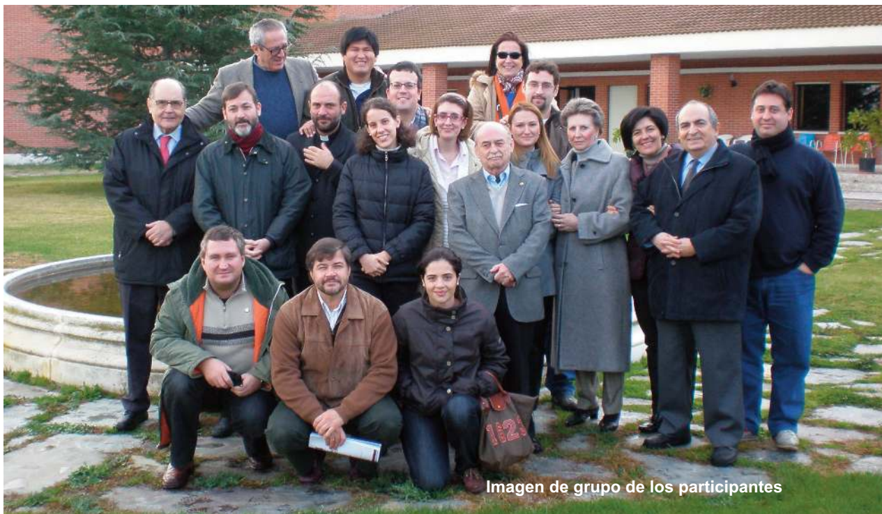
Imagen de grupo de los participantes