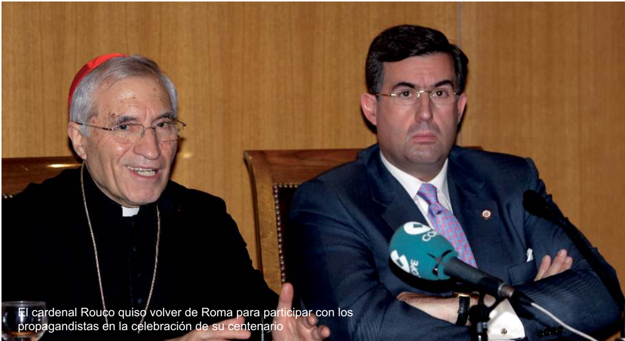
El cardenal Rouco quiso volver de Roma para participar con los propagandistas en la celebración de su centenario