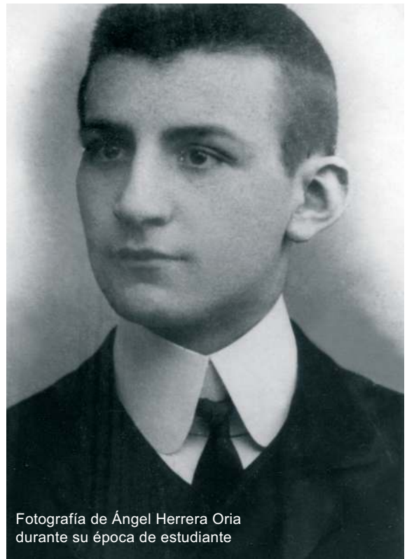
Fotografía de Ángel Herrera Oria durante su época de estudiante

Destinado como abogado del Estado a la Delegación de Hacienda de Burgos, apenas estuvo un año en su plaza, pues el 10 de octubre de 1908 le fue concedida la excedencia que había solicitado. Menos de un mes después, el 4 de noviembre, ya en Madrid e incorporado a la Congregación Mariana