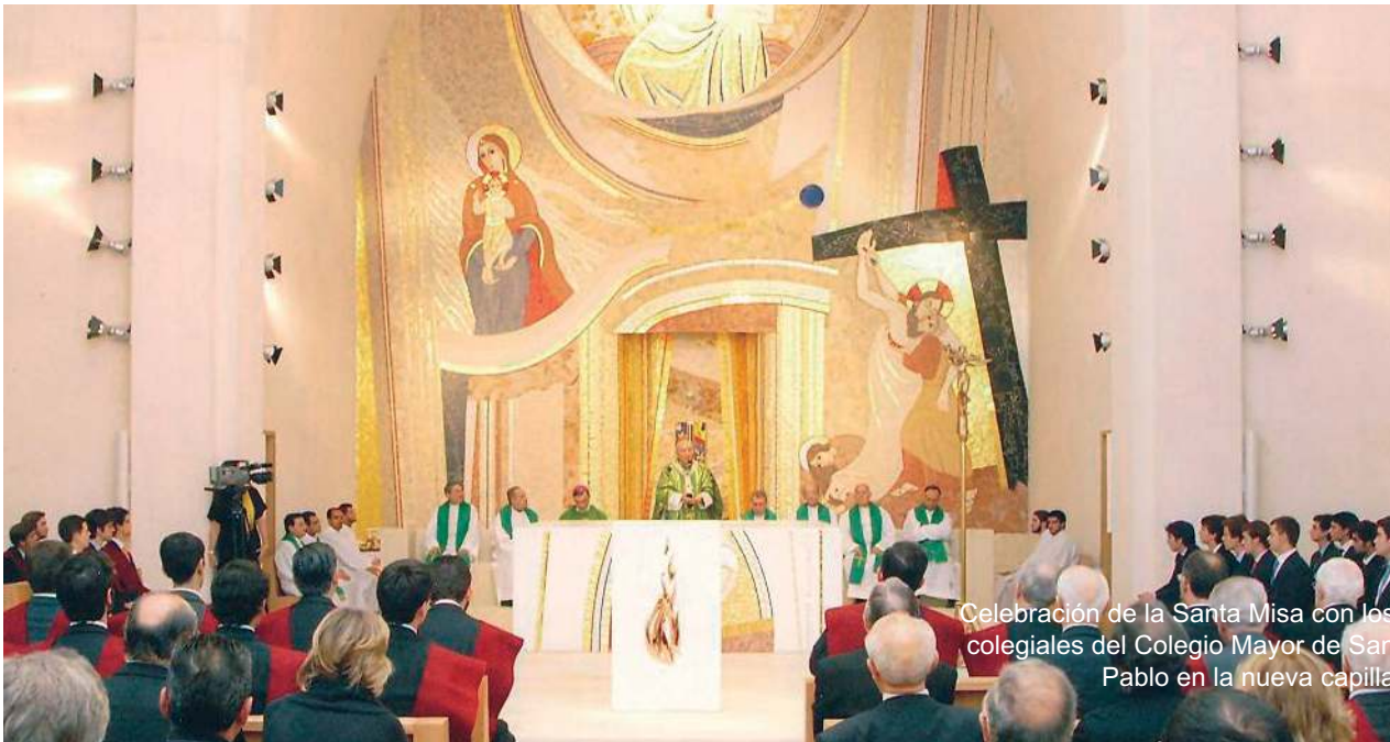
Celebración de la Santa Misa con los colegiales del Colegio Mayor de San Pablo en la nueva capilla

Fue la primera Santa Misa celebrada en el entorno incomparable logrado por el sacerdote y artista Rupnik en la reformada capilla del Colegio Mayor de San Pablo, obra de la ACdP. El cardenal arzobispo de Madrid bendijo estas obras, aún no culminadas, que darán a este templo un nuevo esplendor y lo convertirán en representación clara de la intensa vida sobrenatural de la Asociación.