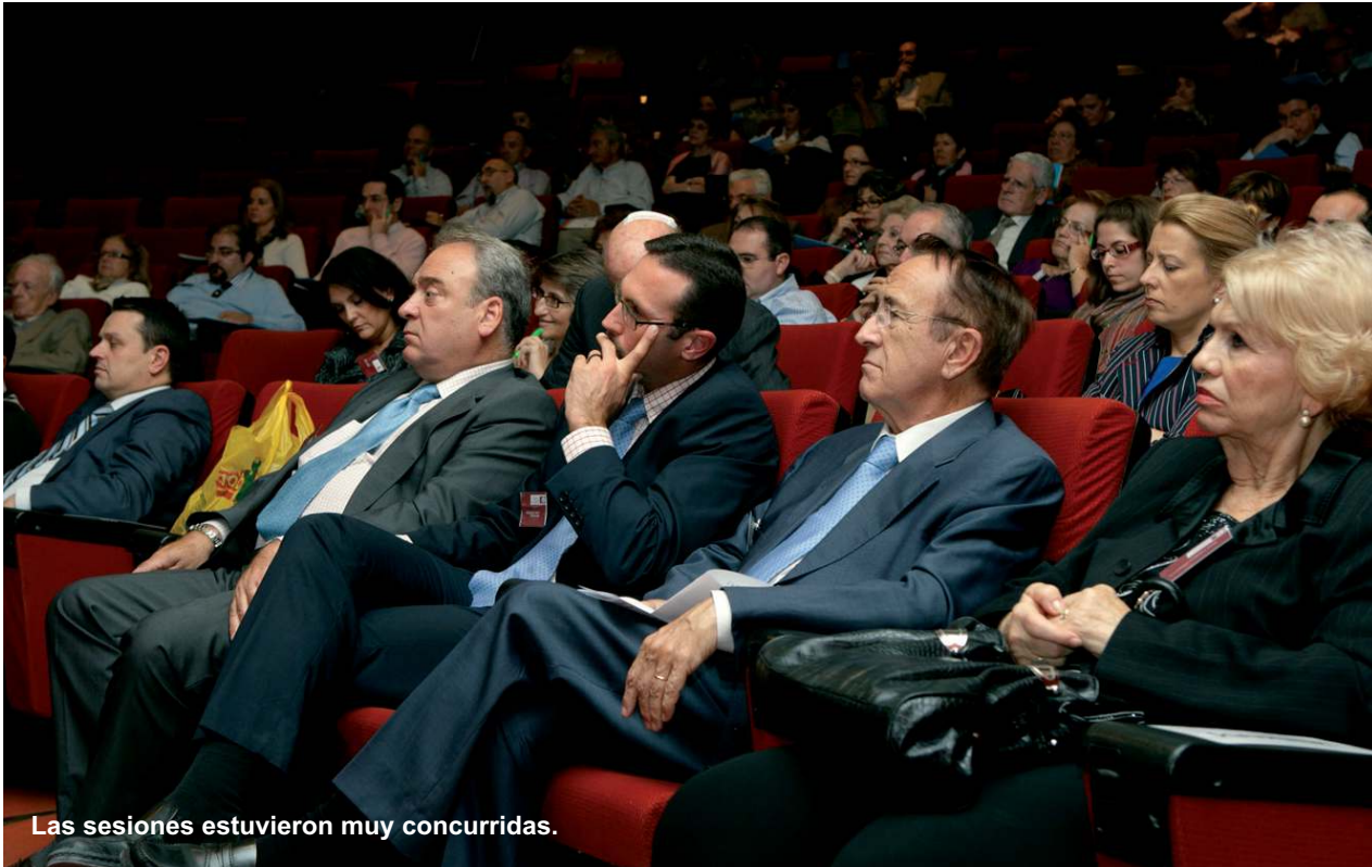
Las sesiones estuvieron muy concurridas.

mento de la corrupción, hay también una baja en la economía”. Tercero, el aumento de las cifras de criminalidad, “ligada a factores económicos y a la eliminación de valores”; y cuarto, un índice “espeluznante” del aborto. En consecuencia, parados, hambre, criminalidad, corrupción, depresión. ¿Cómo puede haber solución de la economía, si no se tratan, primero, estos problemas éticos? Para el economista, esta “crisis económica es una crisis social, moral y ética cuya solución es tarea de todos”. Seguidamente, el economista se refirió a los problemas éticos que se derivan de los políticos y dirigentes de la sociedad, quienes “pretenden resolver las cuestiones por el lado ‘cómodo’ de la demanda, y no por el lado ‘incómodo’ de la oferta”. La solución por el lado de la demanda -que es la que dan los políticos- ha demostrado que frena la actividad económica y no resuelve nada. Entonces, “la solución está por el lado de la oferta”. Pero, ¿y cuáles son los problemas éticos derivados por el lado de la oferta? En opinión del ponente, la solución pasa por la aplicación de diez medidas. Primero, es necesario disponer de energía barata, abundante y de primera calidad. Segundo, la necesidad de un sistema educativo adecuado. “Sin educación es imposible tener alta productividad, sin productividad es imposible competir, y sin competencia es imposible el desarrollo”, sentenció Velarde. Tercero, el avance tecnológico. “Sin ciencia y sin técnica avanzada es imposible desarrollar-